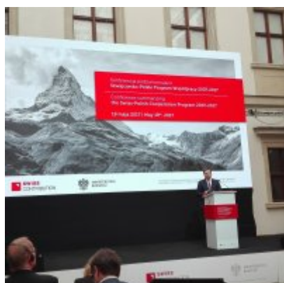
Przedstawiciele Gminy Zator na konferencji podsumowującej realizację Programu Szwajcarskiego