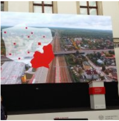
Przedstawiciele Gminy Zator na konferencji podsumowującej realizację Programu