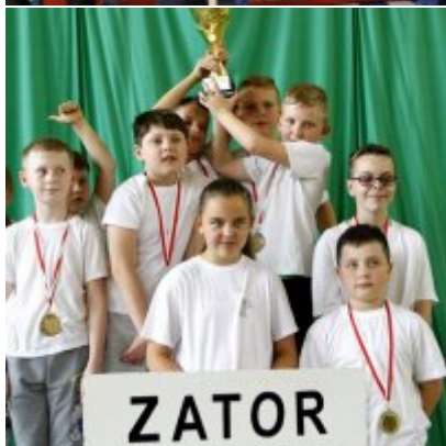
Przedsmak Rio de Janeiro