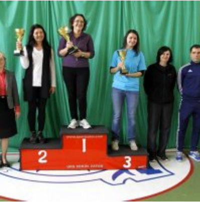
Przedsmak Rio de Janeiro