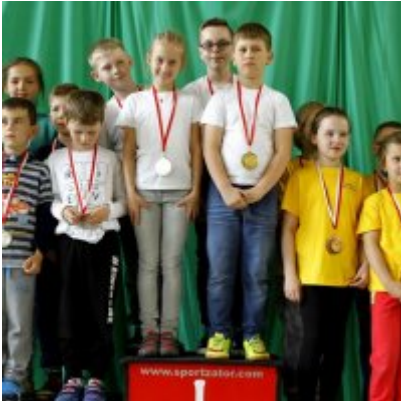
Przedsmak Rio de Janeiro