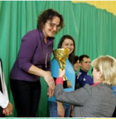
Przedsmak Rio de Janeiro