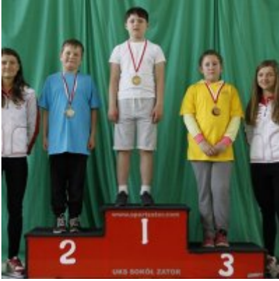
Przedsmak Rio de Janeiro