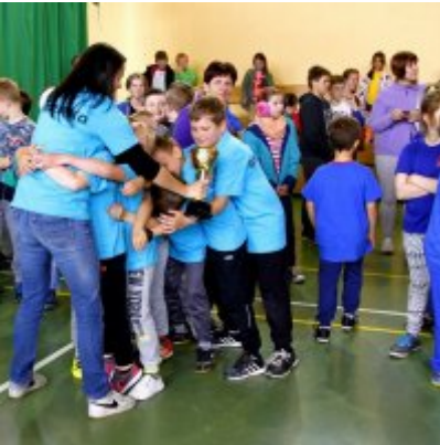
Przedsmak Rio de Janeiro