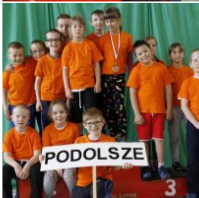
Przedsmak Rio de Janeiro