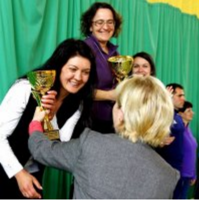
Przedsmak Rio de Janeiro