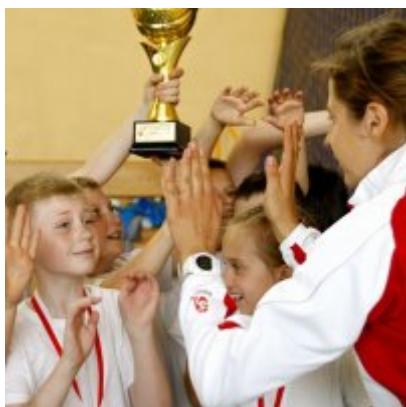
Przedsmak Rio de Janeiro