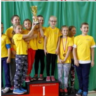
Przedsmak Rio de Janeiro