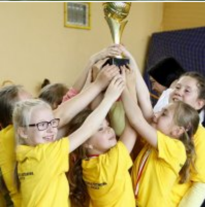
Przedsmak Rio de Janeiro