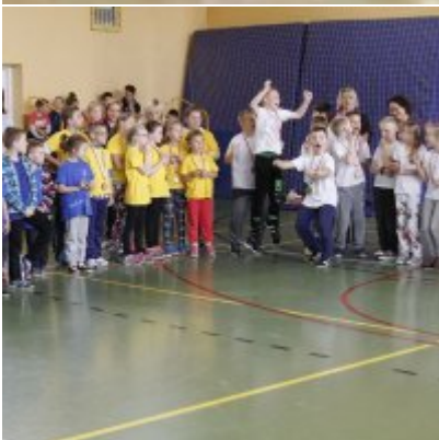
Przedsmak Rio de Janeiro