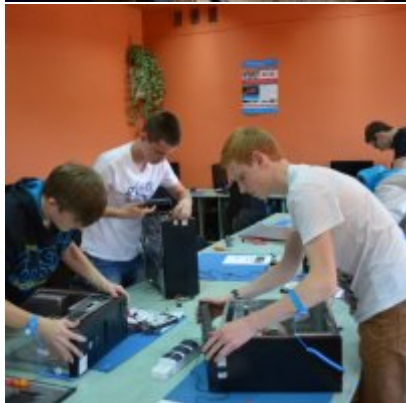
Praktyka w Niemczech