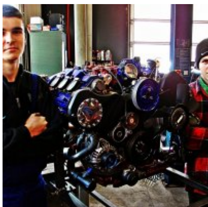
Praktyka w Niemczech