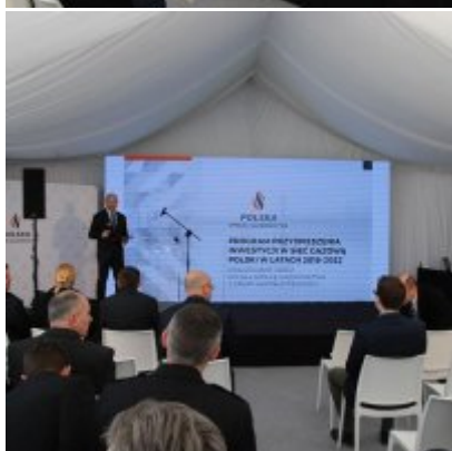
Polska Spółka Gazownictwa uruchomiła w Zatorze pierwszą w Małopolsce stację LNG