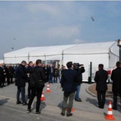
Polska Spółka Gazownictwa uruchomiła w Zatorze pierwszą w Małopolsce stację LNG