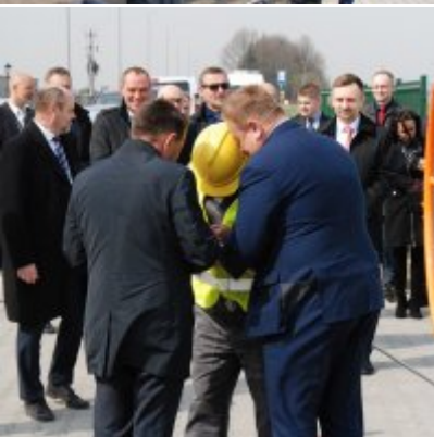
Polska Spółka Gazownictwa uruchomiła w Zatorze pierwszą w Małopolsce stację LNG