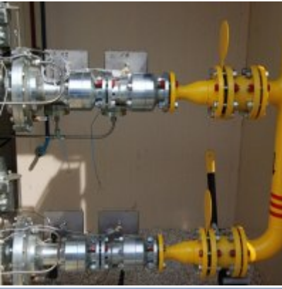
Polska Spółka Gazownictwa uruchomiła w Zatorze pierwszą w Małopolsce stację LNG