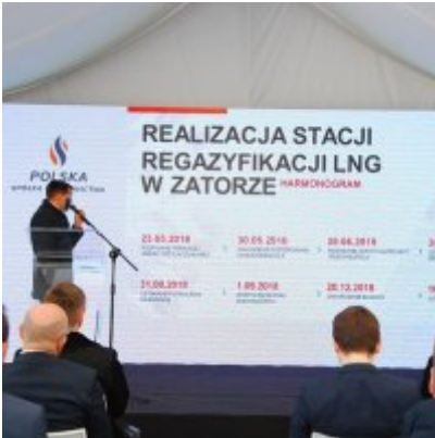
Polska Spółka Gazownictwa uruchomiła w Zatorze pierwszą w Małopolsce stację LNG