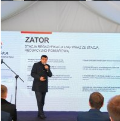
Polska Spółka Gazownictwa uruchomiła w Zatorze pierwszą w Małopolsce stację LNG