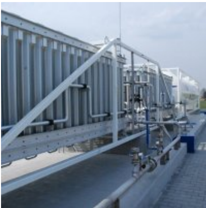
Polska Spółka Gazownictwa uruchomiła w Zatorze pierwszą w Małopolsce stację LNG