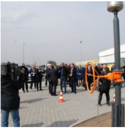
Polska Spółka Gazownictwa uruchomiła w Zatorze pierwszą w Małopolsce stację LNG