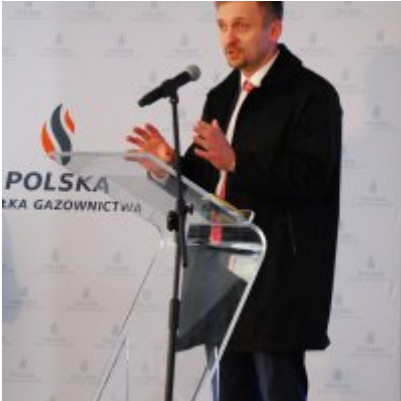
Polska Spółka Gazownictwa uruchomiła w Zatorze pierwszą w Małopolsce stację LNG