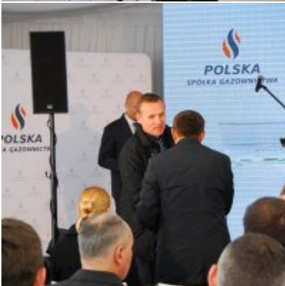
Polska Spółka Gazownictwa uruchomiła w Zatorze pierwszą w Małopolsce stację LNG