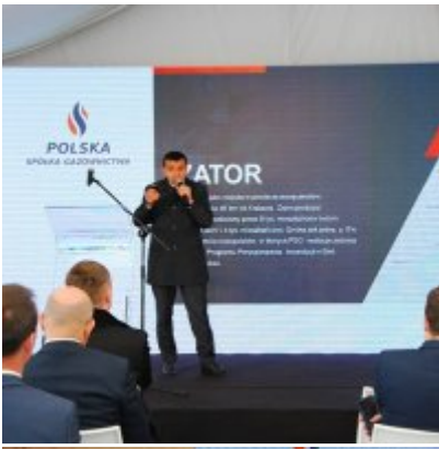
Polska Spółka Gazownictwa uruchomiła w Zatorze pierwszą w Małopolsce stację LNG