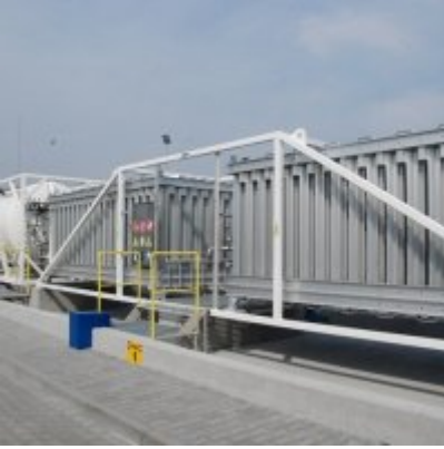
Polska Spółka Gazownictwa uruchomiła w Zatorze pierwszą w Małopolsce stację LNG