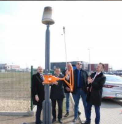
Polska Spółka Gazownictwa uruchomiła w Zatorze pierwszą w Małopolsce stację LNG