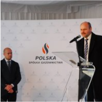
Polska Spółka Gazownictwa uruchomiła w Zatorze pierwszą w Małopolsce stację LNG