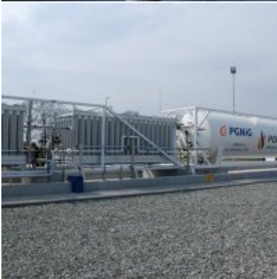
Polska Spółka Gazownictwa uruchomiła w Zatorze pierwszą w Małopolsce stację LNG