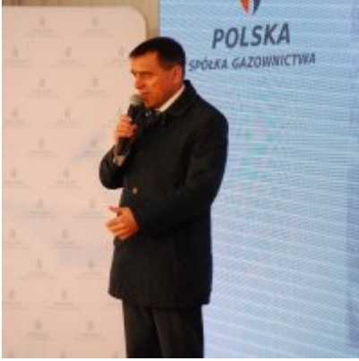
Polska Spółka Gazownictwa uruchomiła w Zatorze pierwszą w Małopolsce stację LNG