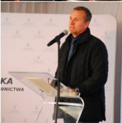
Polska Spółka Gazownictwa uruchomiła w Zatorze pierwszą w Małopolsce stację LNG