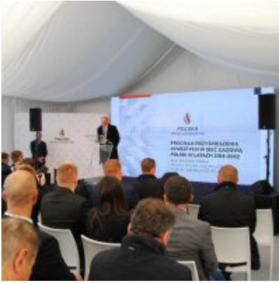
Polska Spółka Gazownictwa uruchomiła w Zatorze pierwszą w Małopolsce stację LNG