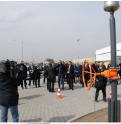
Polska Spółka Gazownictwa uruchomiła w Zatorze pierwszą w Małopolsce stację LNG