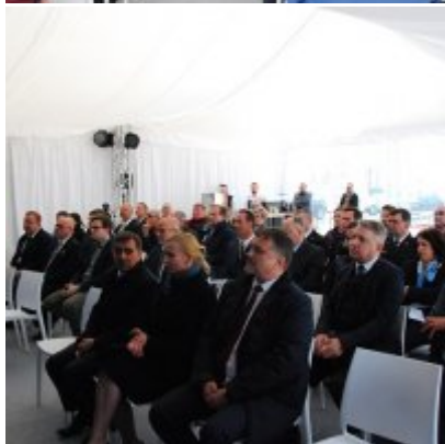
Polska Spółka Gazownictwa uruchomiła w Zatorze pierwszą w Małopolsce stację LNG.