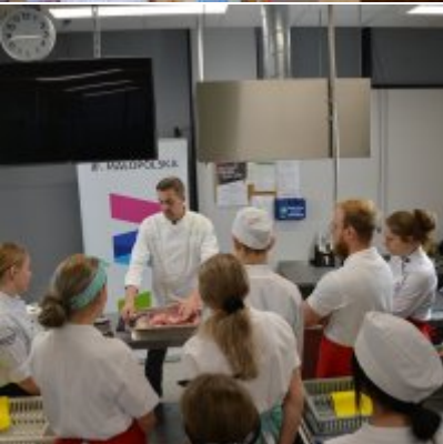
Pokazy gotowania i warsztaty kulinarne w Wielozawodowym Zespole Szkół w Zatorze