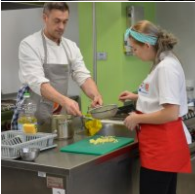
Pokazy gotowania i warsztaty kulinarne w Wielozawodowym Zespole Szkół w Zatorze