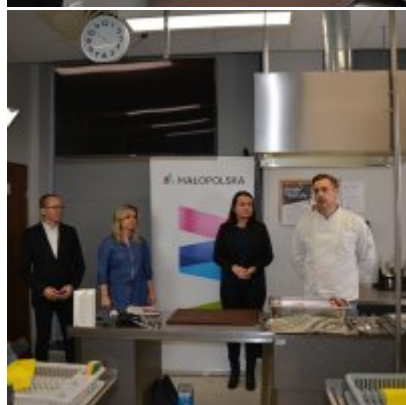
Pokazy gotowania i warsztaty kulinarne w Wielozawodowym Zespole Szkół w Zatorze