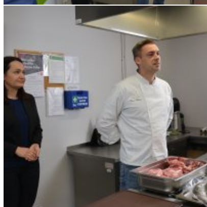
Pokazy gotowania i warsztaty kulinarne w Wielozawodowym Zespole Szkół w Zatorze