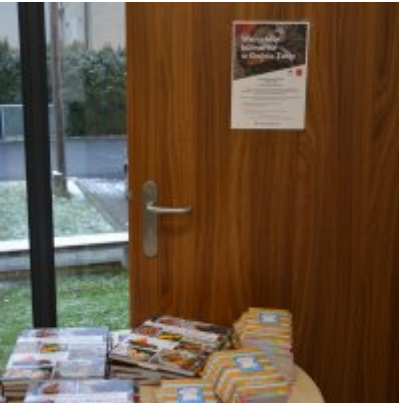
Pokazy gotowania i warsztaty kulinarne w Wielozawodowym Zespole Szkół w Zatorze