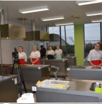
Pokazy gotowania i warsztaty kulinarne w Wielozawodowym Zespole Szkół w Zatorze