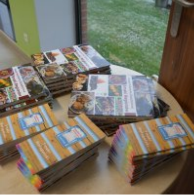
Pokazy gotowania i warsztaty kulinarne w Wielozawodowym Zespole Szkół w Zatorze