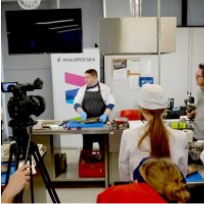
Pokazy gotowania i warsztaty kulinarne w Wielozawodowym Zespole Szkół w Zatorze