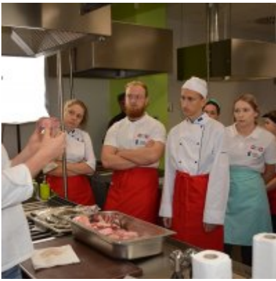
Pokazy gotowania i warsztaty kulinarne w Wielozawodowym Zespole Szkół w Zatorze