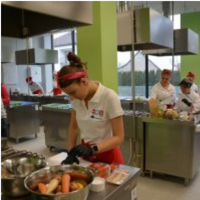
Pokazy gotowania i warsztaty kulinarne w Wielozawodowym Zespole Szkół w Zatorze