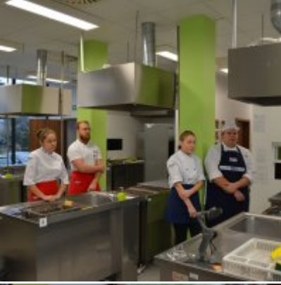
Pokazy gotowania i warsztaty kulinarne w Wielozawodowym Zespole Szkół w Zatorze