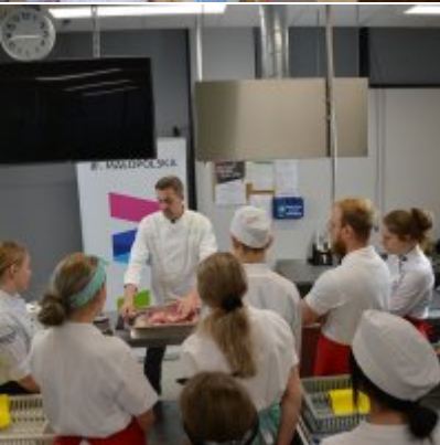
Pokazy gotowania i warsztaty kulinarne w Wielozawodowym Zespole Szkół w Zatorze