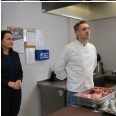
Pokazy gotowania i warsztaty kulinarne w Wielozawodowym Zespole Szkół w Zatorze