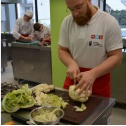
Pokazy gotowania i warsztaty kulinarne w Wielozawodowym Zespole Szkół w Zatorze