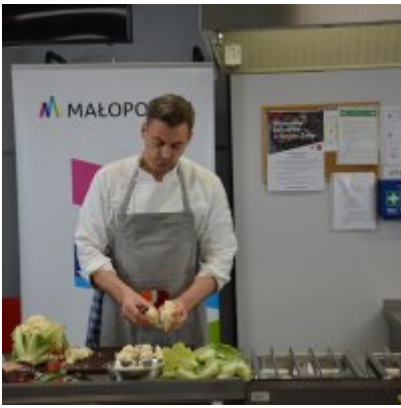
Pokazy gotowania i warsztaty kulinarne w Wielozawodowym Zespole Szkół w Zatorze