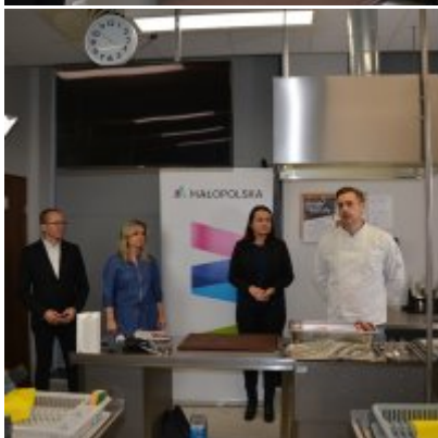
Pokazy gotowania i warsztaty kulinarne w Wielozawodowym Zespole Szkół w Zatorze