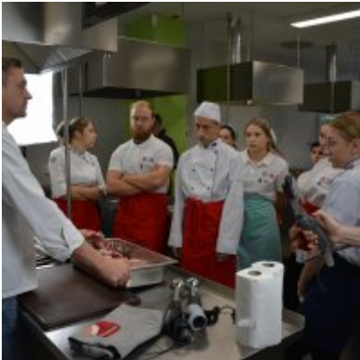
Pokazy gotowania i warsztaty kulinarne w Wielozawodowym Zespole Szkół w Zatorze