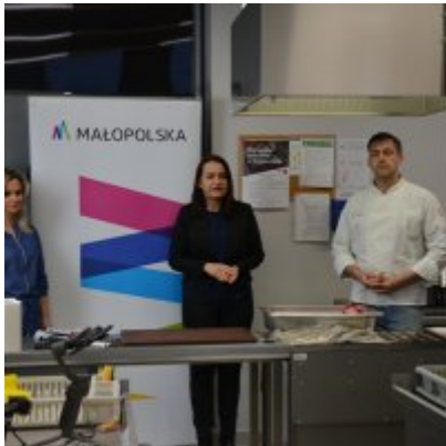
Pokazy gotowania i warsztaty kulinarne w Wielozawodowym Zespole Szkół w Zatorze