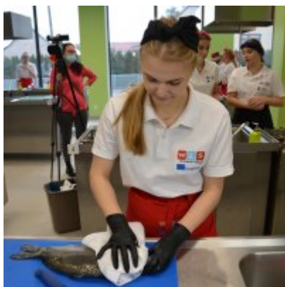
Pokazy gotowania i warsztaty kulinarne w Wielozawodowym Zespole Szkół w Zatorze