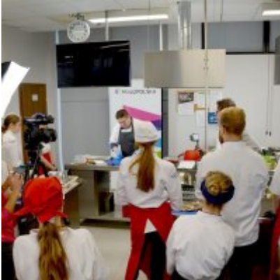
Pokazy gotowania i warsztaty kulinarne w Wielozawodowym Zespole Szkół w Zatorze