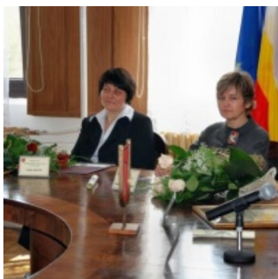
Otwarcie Ratusza Miejskiego – Biblioteki Publicznej im. Pawła z Zatora