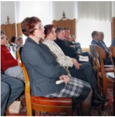
Otwarcie Ratusza Miejskiego – Biblioteki Publicznej im. Pawła z Zatora