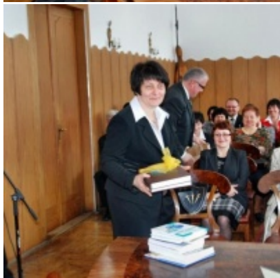
Otwarcie Ratusza Miejskiego – Biblioteki Publicznej im. Pawła z Zatora