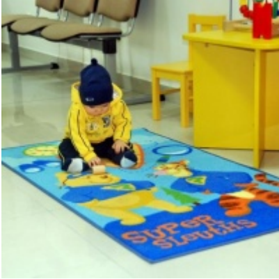
Otwarcie Ratusza Miejskiego – Biblioteki Publicznej im. Pawła z Zatora