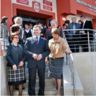
Otwarcie Ratusza Miejskiego – Biblioteki Publicznej im. Pawła z Zatora