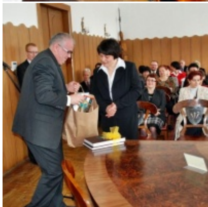
Otwarcie Ratusza Miejskiego – Biblioteki Publicznej im. Pawła z Zatora