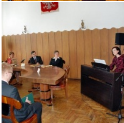
Otwarcie Ratusza Miejskiego – Biblioteki Publicznej im. Pawła z Zatora