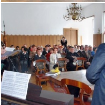
Otwarcie Ratusza Miejskiego – Biblioteki Publicznej im. Pawła z Zatora