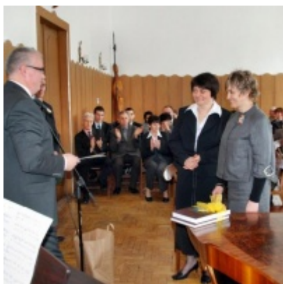
Otwarcie Ratusza Miejskiego – Biblioteki Publicznej im. Pawła z Zatora