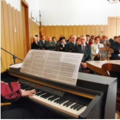
Otwarcie Ratusza Miejskiego – Biblioteki Publicznej im. Pawła z Zatora