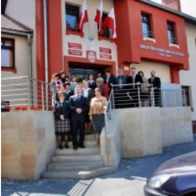
Otwarcie Ratusza Miejskiego – Biblioteki Publicznej im. Pawła z Zatora