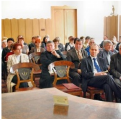
Otwarcie Ratusza Miejskiego – Biblioteki Publicznej im. Pawła z Zatora