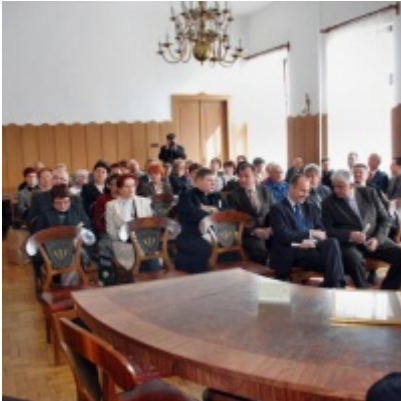
Otwarcie Ratusza Miejskiego – Biblioteki Publicznej im. Pawła z Zatora