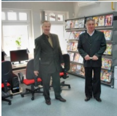
Otwarcie Ratusza Miejskiego – Biblioteki Publicznej im. Pawła z Zatora