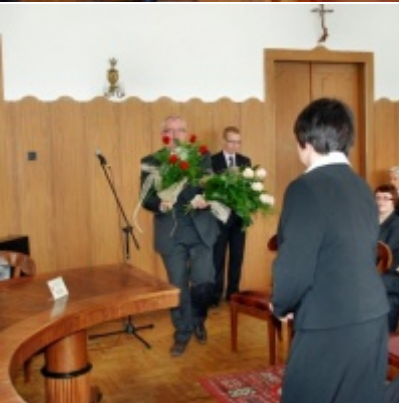
Otwarcie Ratusza Miejskiego – Biblioteki Publicznej im. Pawła z Zatora