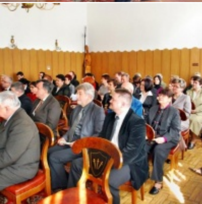
Otwarcie Ratusza Miejskiego – Biblioteki Publicznej im. Pawła z Zatora