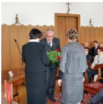
Otwarcie Ratusza Miejskiego – Biblioteki Publicznej im. Pawła z Zatora