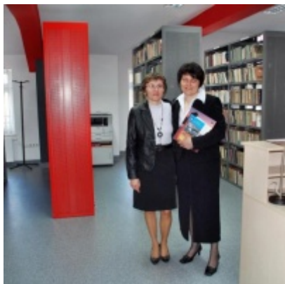
Otwarcie Ratusza Miejskiego – Biblioteki Publicznej im. Pawła z Zatora