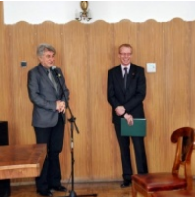
Otwarcie Ratusza Miejskiego – Biblioteki Publicznej im. Pawła z Zatora