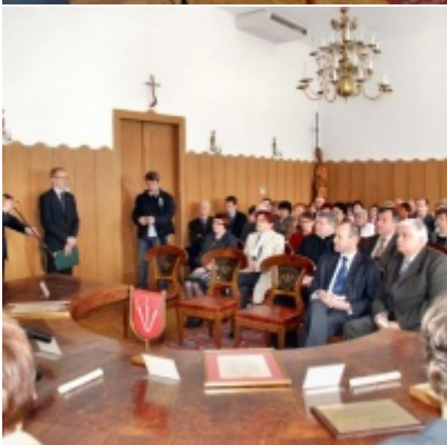
Otwarcie Ratusza Miejskiego – Biblioteki Publicznej im. Pawła z Zatora