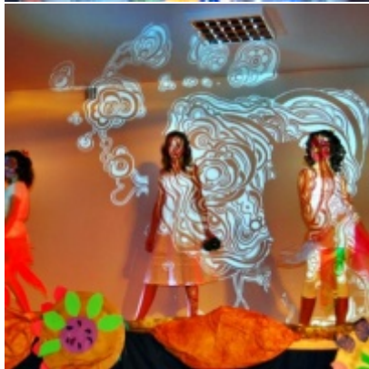
Otwarcie Domu Ludowego w Graboszycach