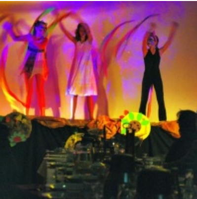
Otwarcie Domu Ludowego w Graboszycach