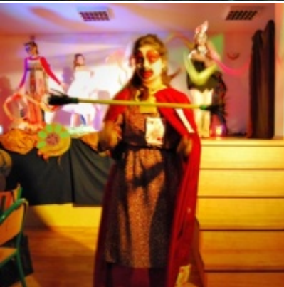
Otwarcie Domu Ludowego w Graboszycach