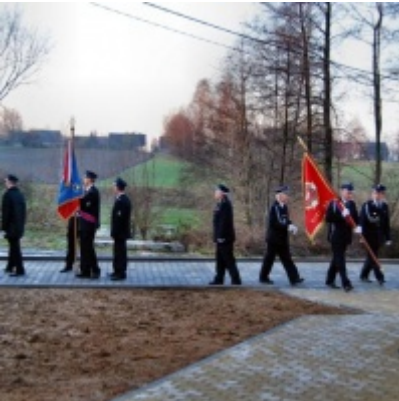
Otwarcie Domu Ludowego w Graboszycach