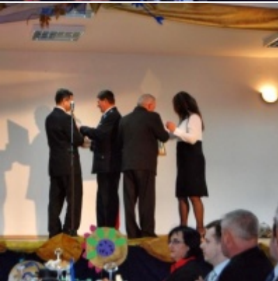
Otwarcie Domu Ludowego w Graboszycach