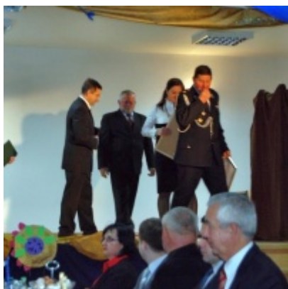
Otwarcie Domu Ludowego w Graboszycach