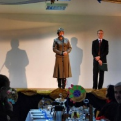
Otwarcie Domu Ludowego w Graboszycach