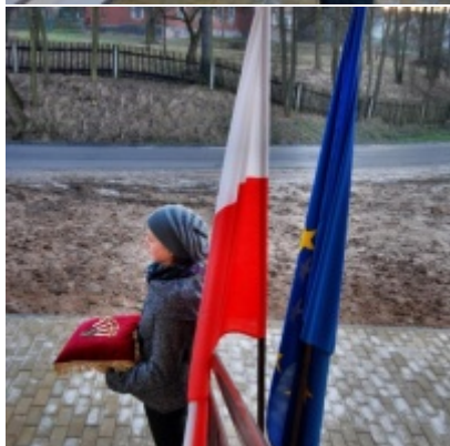
Otwarcie Domu Ludowego w Graboszycach