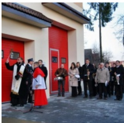
Otwarcie Domu Ludowego w Graboszycach