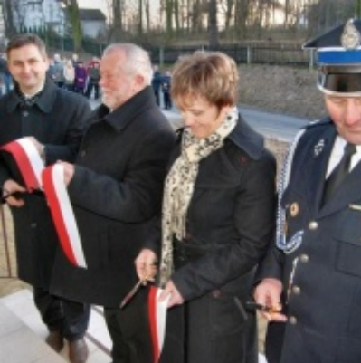
Otwarcie Domu Ludowego w Graboszycach