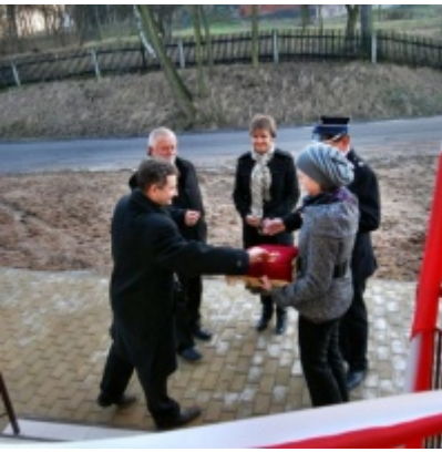
Otwarcie Domu Ludowego w Graboszycach