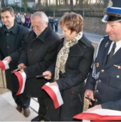
Otwarcie Domu Ludowego w Graboszycach