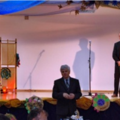
Otwarcie Domu Ludowego w Graboszycach