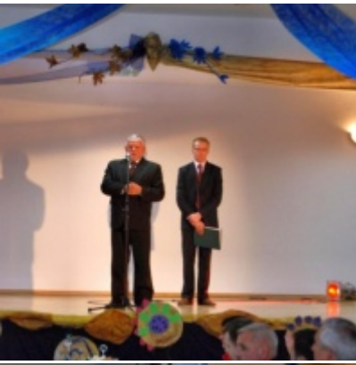
Otwarcie Domu Ludowego w Graboszycach