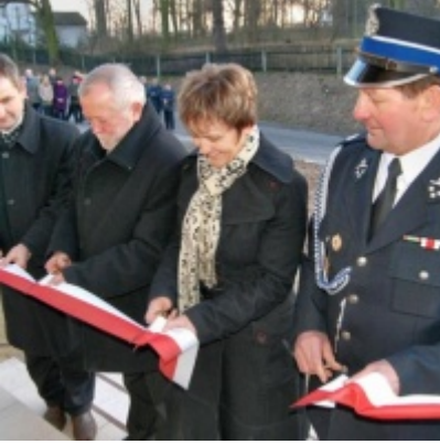
Otwarcie Domu Ludowego w Graboszycach