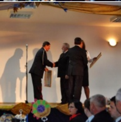
Otwarcie Domu Ludowego w Graboszycach