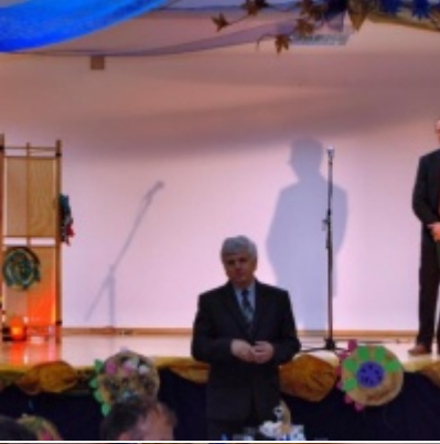
Otwarcie Domu Ludowego w Graboszycach