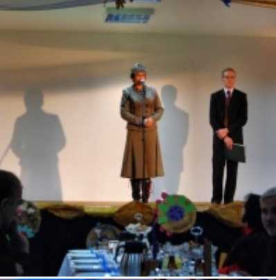
Otwarcie Domu Ludowego w Graboszycach