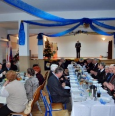
Otwarcie Domu Ludowego w Graboszycah