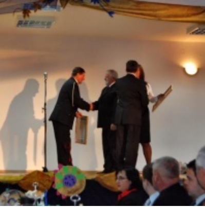
Otwarcie Domu Ludowego w Graboszycach