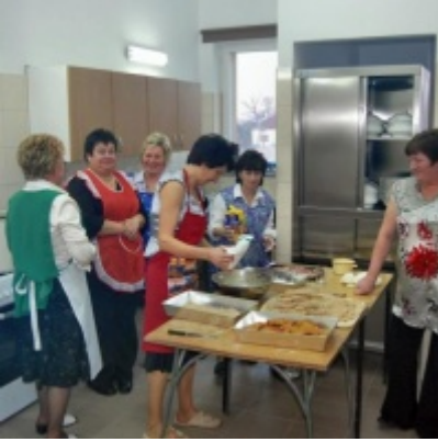
Otwarcie Domu Ludowego w Graboszycah