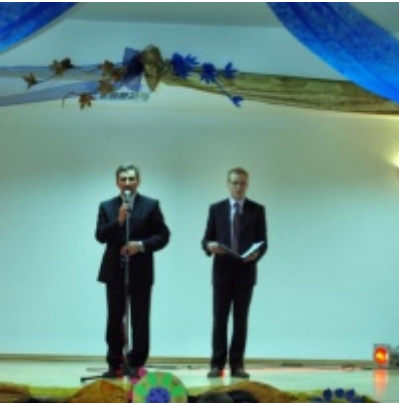
Otwarcie Domu Ludowego w Graboszycah