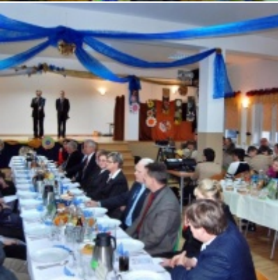
Otwarcie Domu Ludowego w Graboszycah