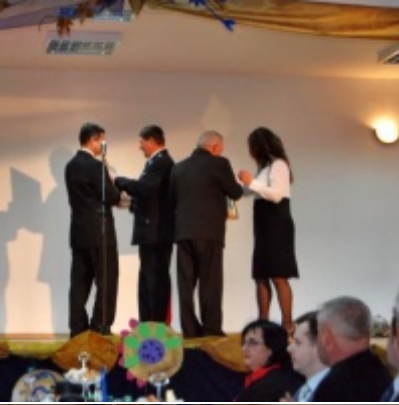
Otwarcie Domu Ludowego w Graboszycach