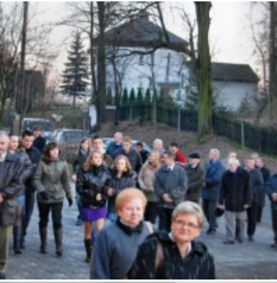
Otwarcie Domu Ludowego w Graboszycah