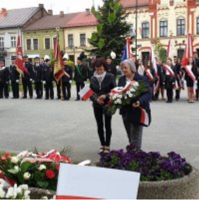
Obchody Święta Konstytucji 3 Maja