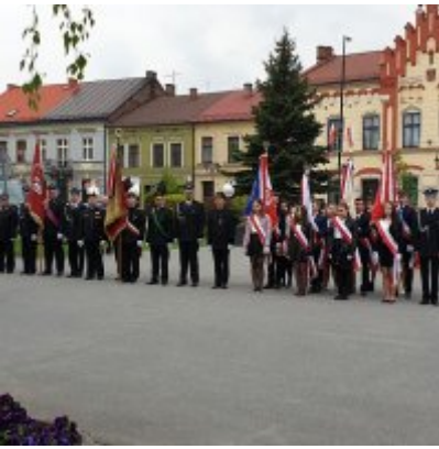
Obchody Święta Konstytucji 3 Maja