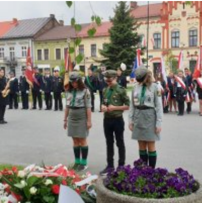
Obchody Święta Konstytucji 3 Maja