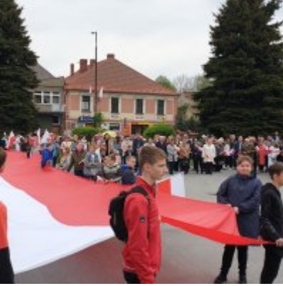
Obchody Święta Konstytucji 3 Maja