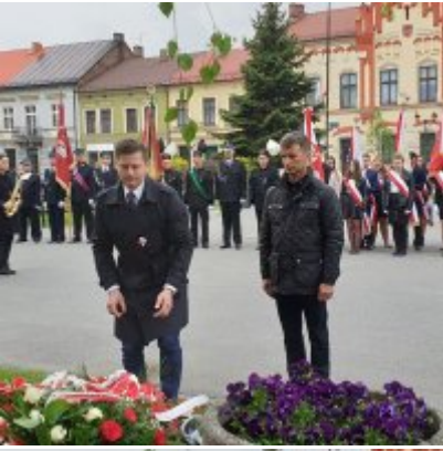
Obchody Święta Konstytucji 3 Maja