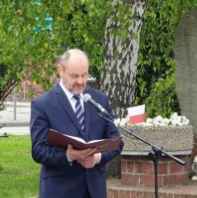
Obchody Święta Konstytucji 3 Maja