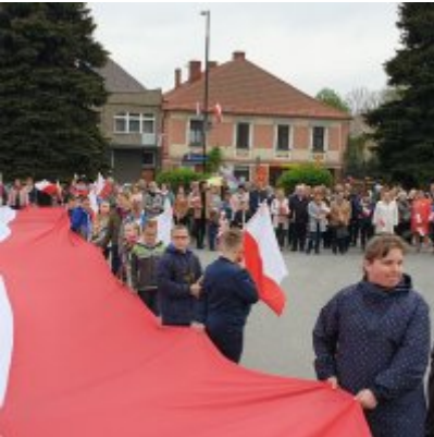
Obchody Święta Konstytucji 3 Maja