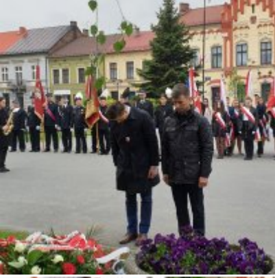
Obchody Święta Konstytucji 3 Maja