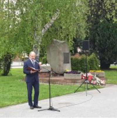
Obchody Święta Konstytucji 3 Maja