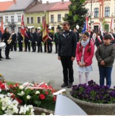
Obchody Święta Konstytucji 3 Maja