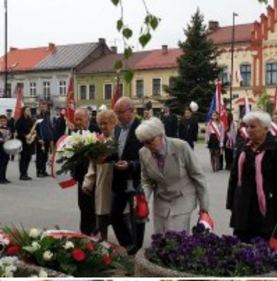
Obchody Święta Konstytucji 3 Maja