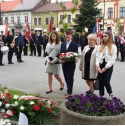
Obchody Święta Konstytucji 3 Maja