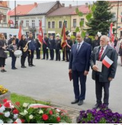
Obchody Święta Konstytucji 3 Maja