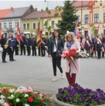
Obchody Święta Konstytucji 3 Maja