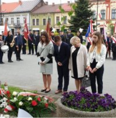
Obchody Święta Konstytucji 3 Maja