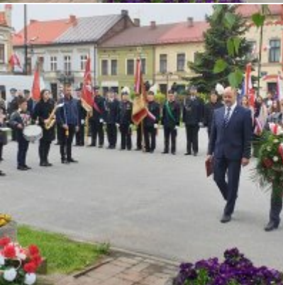
Obchody Święta Konstytucji 3 Maja