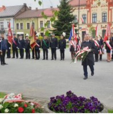
Obchody Święta Konstytucji 3 Maja