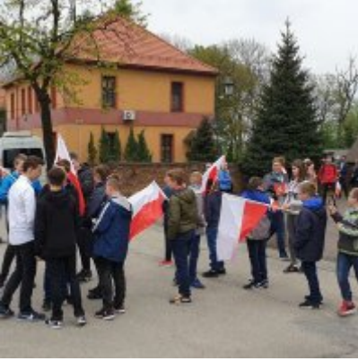
Obchody Święta Konstytucji 3 Maja