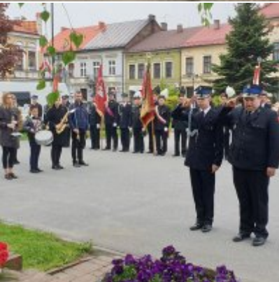
Obchody Święta Konstytucji 3 Maja