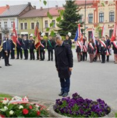
Obchody Święta Konstytucji 3 Maja