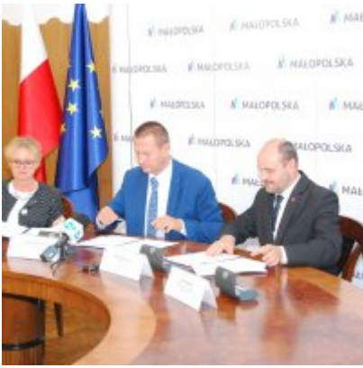
OBWODNICA PODOLSKA ... ZA DWA LATA