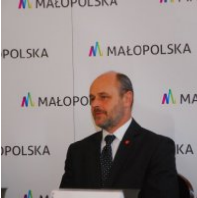
OBWODNICA PODOLSKA ... ZA DWA LATA