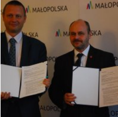
OBWODNICA PODOLSKA ... ZA DWA LATA