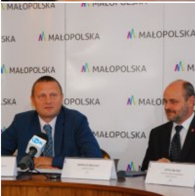
OBWODNICA PODOLSZA ... ZA DWA LATA