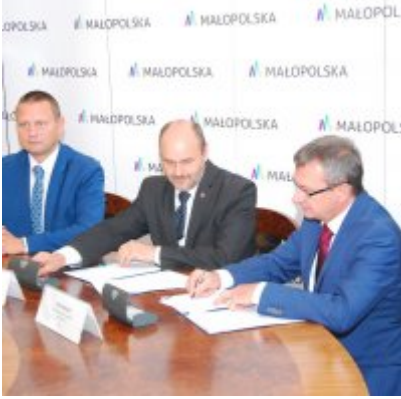
OBWODNICA PODOLSKA ... ZA DWA LATA