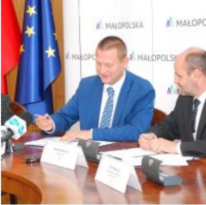
OBWODNICA PODOLSKA ... ZA DWA LATA