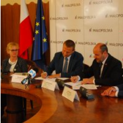
OBWODNICA PODOLSKA ... ZA DWA LATA