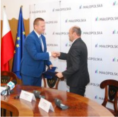
OBWODNICA PODOLSKA ... ZA DWA LATA