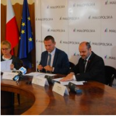
OBWODNICA PODOLSKA ... ZA DWA LATA