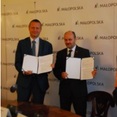
OBWODNICA PODOLSKA ... ZA DWA LATA