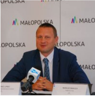
OBWODNICA PODOLSKA ... ZA DWA LATA