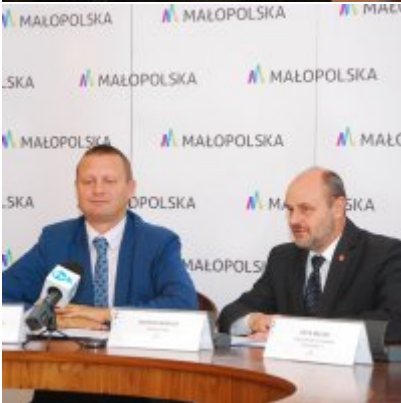
OBWODNICA PODOLSKA ... ZA DWA LATA