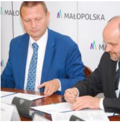
OBWODNICA PODOLSKA ... ZA DWA LATA