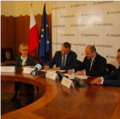
OBWODNICA PODOLSKA ... ZA DWA LATA