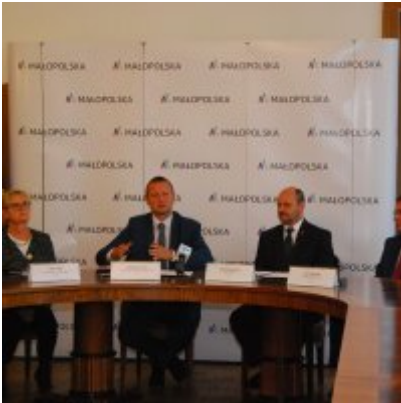
OBWODNICA PODOLSKA ... ZA DWA LATA