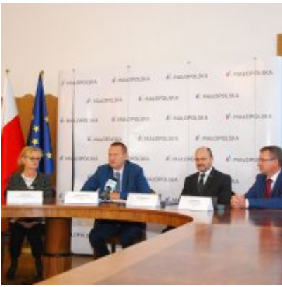
OBWODNICA PODOLSKA ... ZA DWA LATA