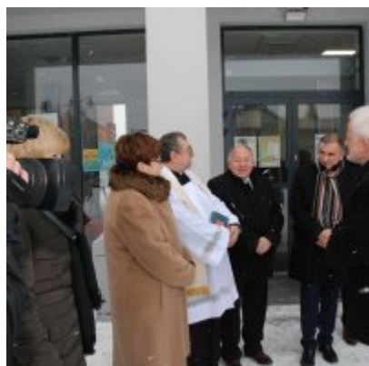
Nowoczesna karetka dla Zatora