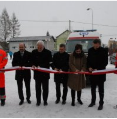
Nowoczesna karetka dla Zatora