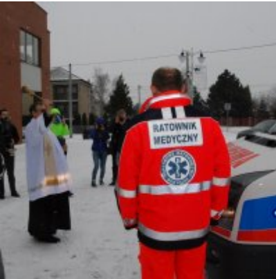
Nowoczesna karetka dla Zatora