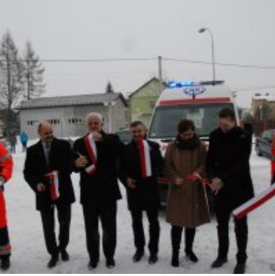
Nowoczesna karetka dla Zatora