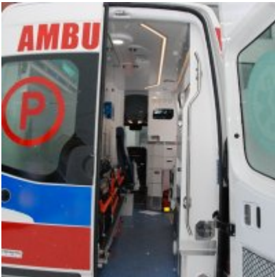
Nowoczesna karetka dla Zatora