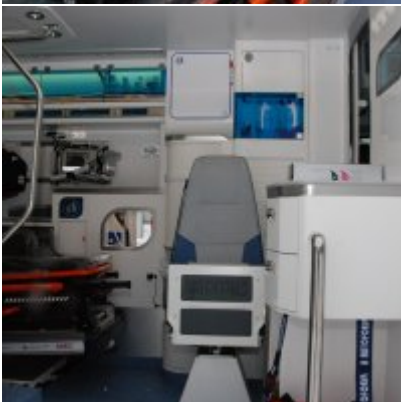
Nowoczesna karetka dla Zatora