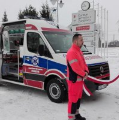
Nowoczesna karetka dla Zatora