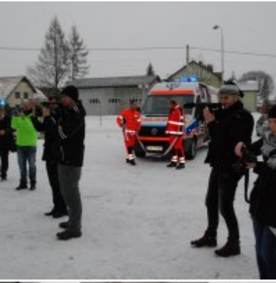
Nowoczesna karetka dla Zatora