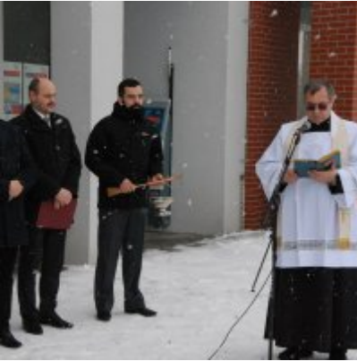
Nowoczesna karetka dla Zatora