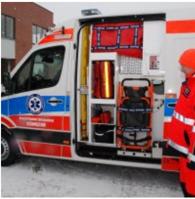
Nowoczesna karetka dla Zatora