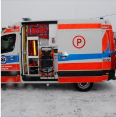
Nowoczesna karetka dla Zatora