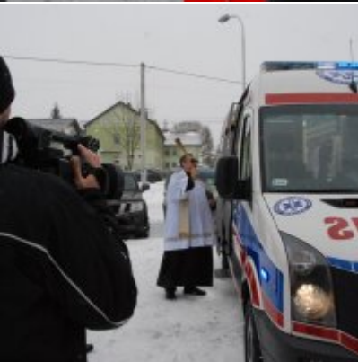
Nowoczesna karetka dla Zatora