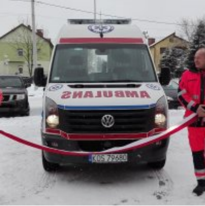
Nowoczesna karetka dla Zatora