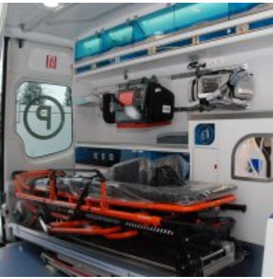
Nowoczesna karetka dla Zatora