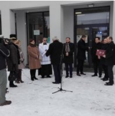
Nowoczesna karetka dla Zatora