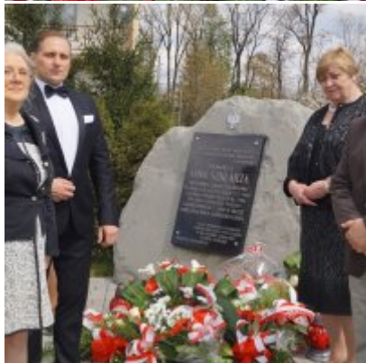
Nauczycielski Dzień Pamięci i Pokoju 2016