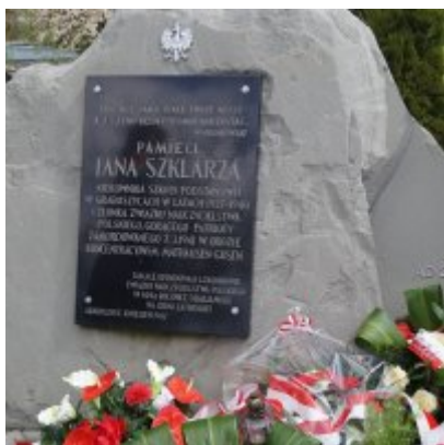
Nauczycielski Dzień Pamięci i Pokoju 2016