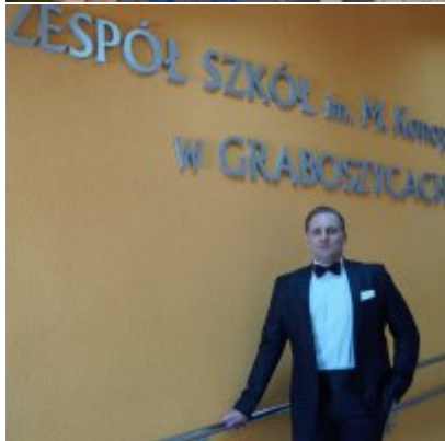
Nauczycielski Dzień Pamięci i Pokoju 2016