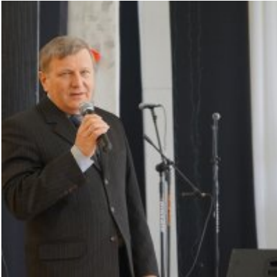
Nauczycielski Dzień Pamięci i Pokoju 2016