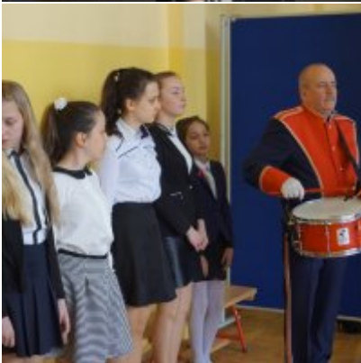
Nauczycielski Dzień Pamięci i Pokoju 2016