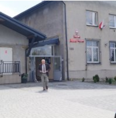
Nauczycielski Dzień Pamięci i Pokoju 2016