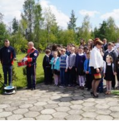
Nauczycielski Dzień Pamięci i Pokoju 2016