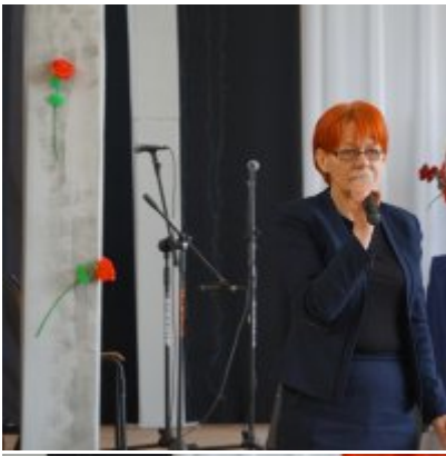
Nauczycielski Dzień Pamięci i Pokoju 2016