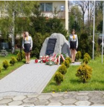
Nauczycielski Dzień Pamięci i Pokoju 2016