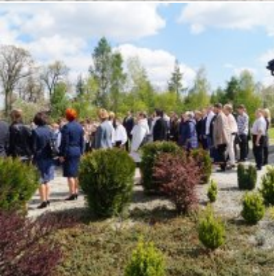
Nauczycielski Dzień Pamięci i Pokoju 2016