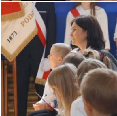
Nauczycielski Dzień Pamięci i Pokoju 2016