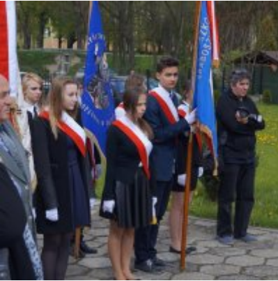
Nauczycielski Dzień Pamięci i Pokoju 2016