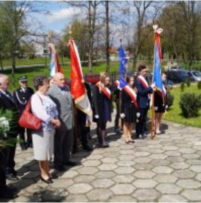
Nauczycielski Dzień Pamięci i Pokoju 2016