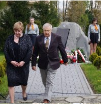
Nauczycielski Dzień Pamięci i Pokoju 2016