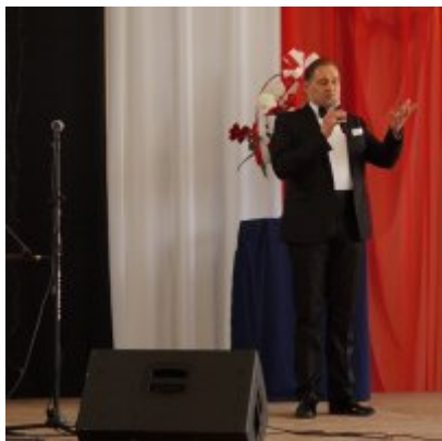
Nauczycielski Dzień Pamięci i Pokoju 2016