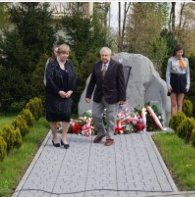
Nauczycielski Dzień Pamięci i Pokoju 2016