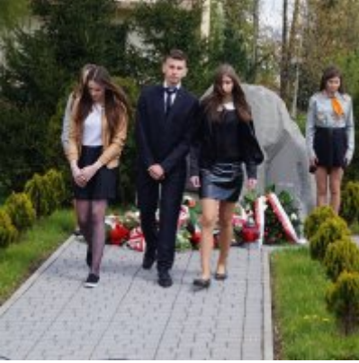
Nauczycielski Dzień Pamięci i Pokoju 2016