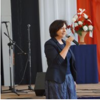
Nauczycielski Dzień Pamięci i Pokoju 2016