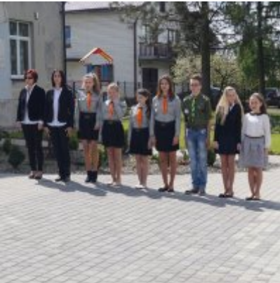
Nauczycielski Dzień Pamięci i Pokoju 2016