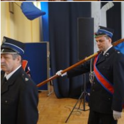
Nauczycielski Dzień Pamięci i Pokoju 2016