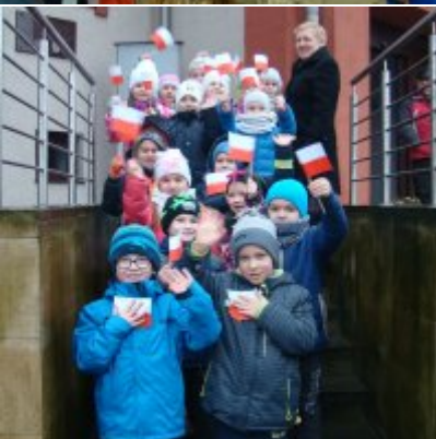
Narodowy Dzień Pamięci Żołnierzy Wyklętych w ZSO Zator