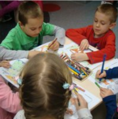
Narodowy Dzień Pamięci Żołnierzy Wyklętych w ZSO Zator