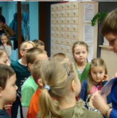
Narodowy Dzień Pamięci Żołnierzy Wyklętych w ZSO Zator