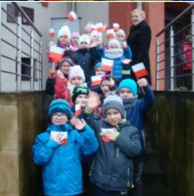
Narodowy Dzień Pamięci Żołnierzy Wyklętych w ZSO Zator