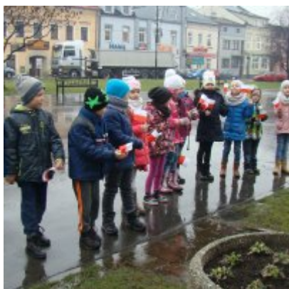
Narodowy Dzień Pamięci Żołnierzy Wyklętych w ZSO Zator