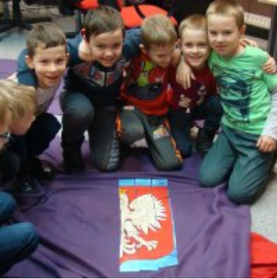
Narodowy Dzień Pamięci Żołnierzy Wyklętych w ZSO Zator