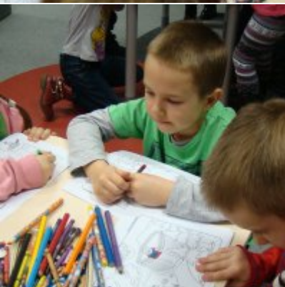
Narodowy Dzień Pamięci Żołnierzy Wyklętych w ZSO Zator