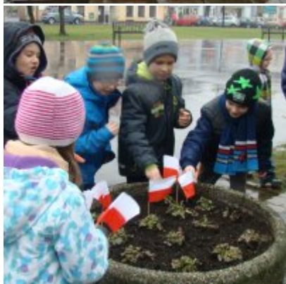
Narodowy Dzień Pamięci Żołnierzy Wyklętych w ZSO Zator