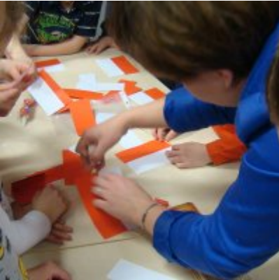
Narodowy Dzień Pamięci Żołnierzy Wyklętych w ZSO Zator