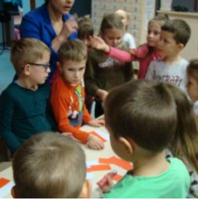
Narodowy Dzień Pamięci Żołnierzy Wyklętych w ZSO Zator