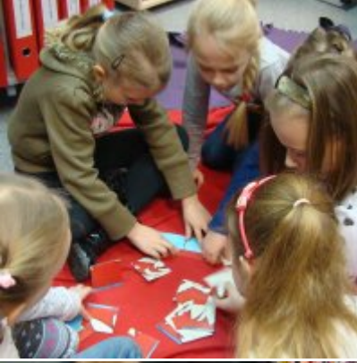
Narodowy Dzień Pamięci Żołnierzy Wyklętych w ZSO Zator