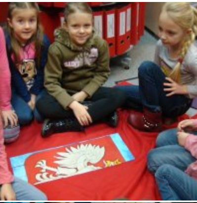
Narodowy Dzień Pamięci Żołnierzy Wyklętych w ZSO Zator