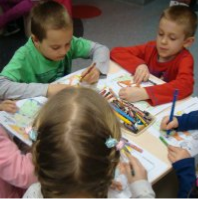
Narodowy Dzień Pamięci Żołnierzy Wyklętych w ZSO Zator