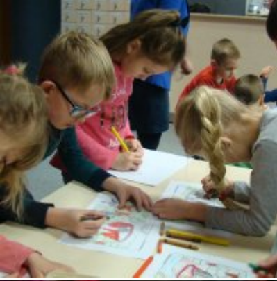
Narodowy Dzień Pamięci Żołnierzy Wyklętych w ZSO Zator