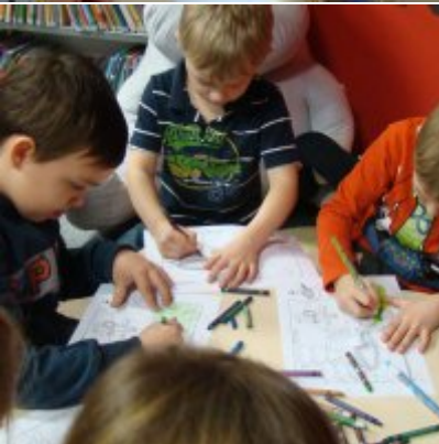
Narodowy Dzień Pamięci Żołnierzy Wyklętych w ZSO Zator