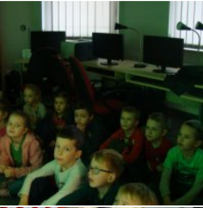
Narodowy Dzień Pamięci Żołnierzy Wyklętych w ZSO Zator