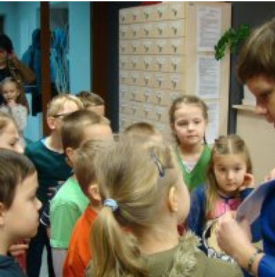
Narodowy Dzień Pamięci Żołnierzy Wyklętych w ZSO Zator