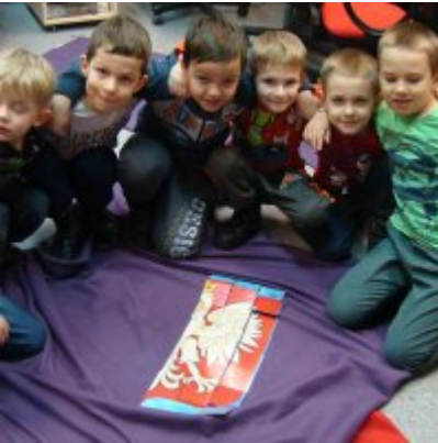
Narodowy Dzień Pamięci Żołnierzy Wyklętych w ZSO Zator