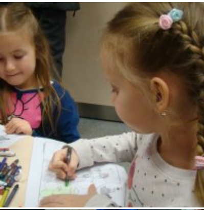
Narodowy Dzień Pamięci Żołnierzy Wyklętych w ZSO Zator