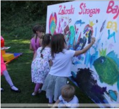
Najlepsze stoisko dla ROKu