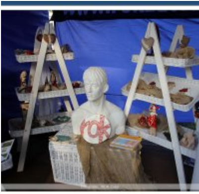
Najlepsze stoisko dla ROKu