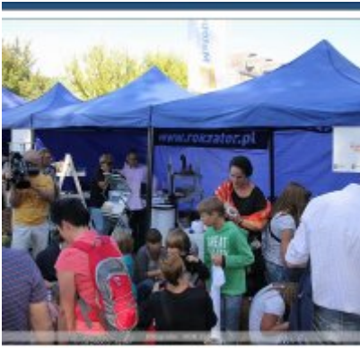
Najlepsze stoisko dla ROKu