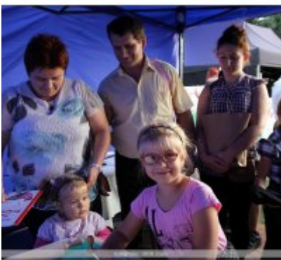
Najlepsze stoisko dla ROKu