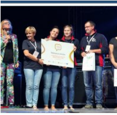
Najlepsze stoisko dla ROKu