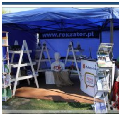
Najlepsze stoisko dla ROKu