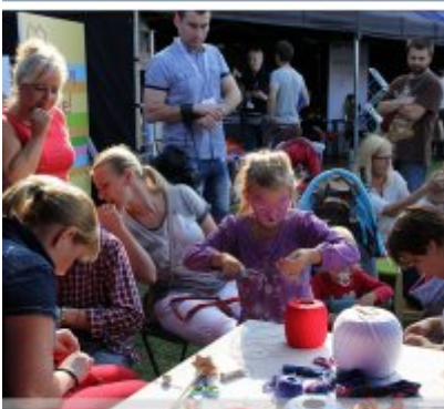
Najlepsze stoisko dla ROKu