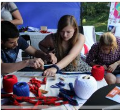
Najlepsze stoisko dla ROKu