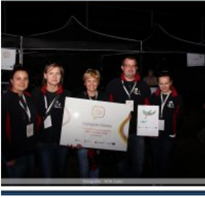
Najlepsze stoisko dla ROKu