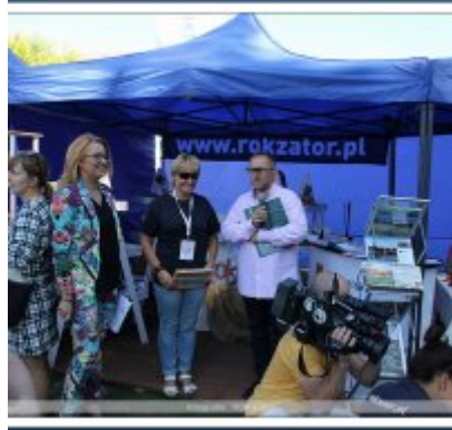
Najlepsze stoisko dla ROKu