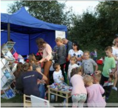
Najlepsze stoisko dla ROKu