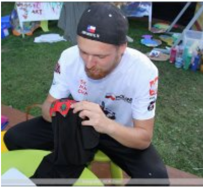
Najlepsze stoisko dla ROKu