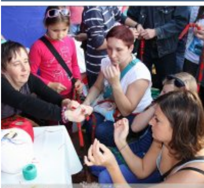
Najlepsze stoisko dla ROKu