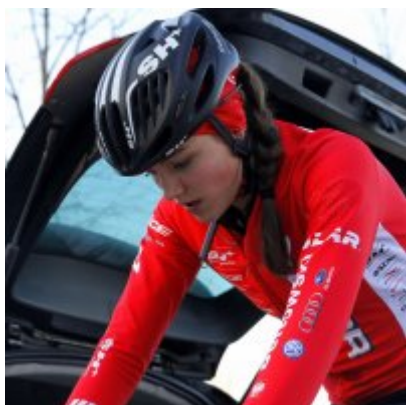
Na zakończenie sezonu medal w Pucharze Polski