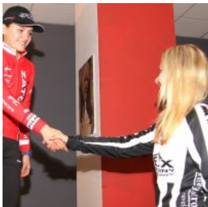
Na zakończenie sezonu medal w Pucharze Polski