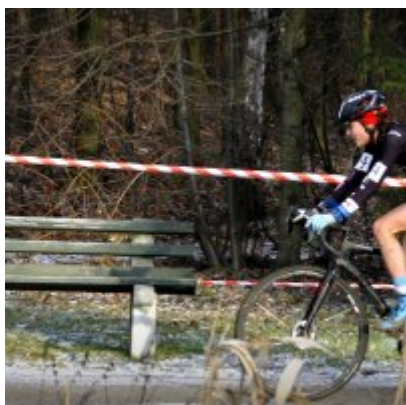
Na zakończenie sezonu medal w Pucharze Polski