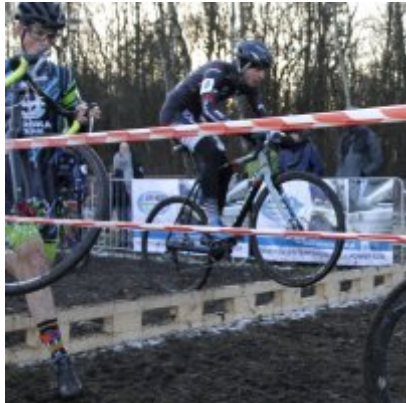
Na zakończenie sezonu medal w Pucharze Polski