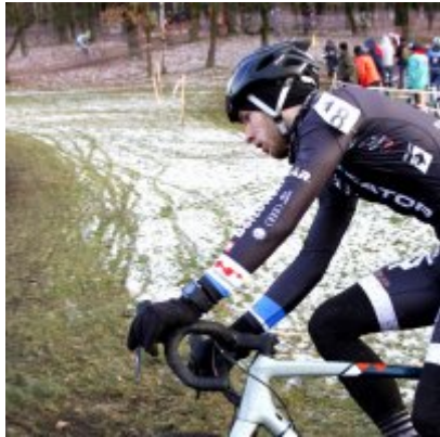
Na zakończenie sezonu medal w Pucharze Polski