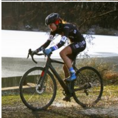
Na zakończenie sezonu medal w Pucharze Polski