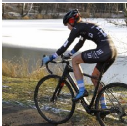
Na zakończenie sezonu medal w Pucharze Polski