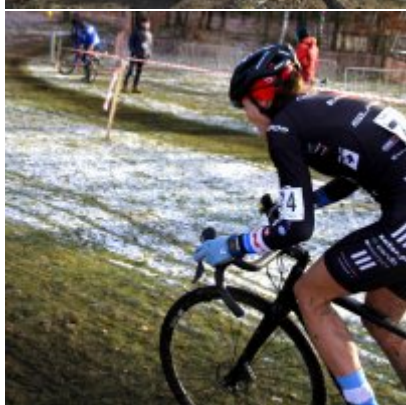
Na zakończenie sezonu medal w Pucharze Polski