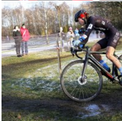
Na zakończenie sezonu medal w Pucharze Polski