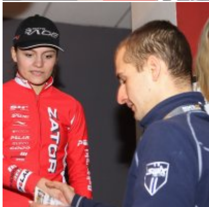
Na zakończenie sezonu medal w Pucharze Polski