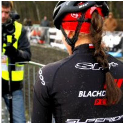
Na zakończenie sezonu medal w Pucharze Polski