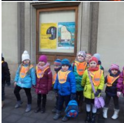
WIZYTA W FILHARMONII