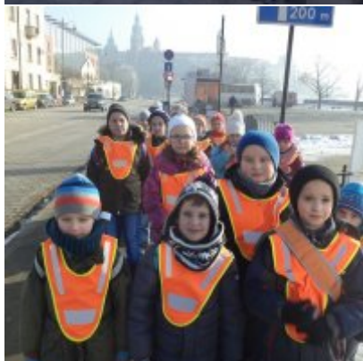
WIZYTA W FILHARMONII