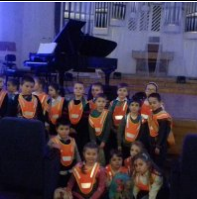
WIZYTA W FILHARMONII