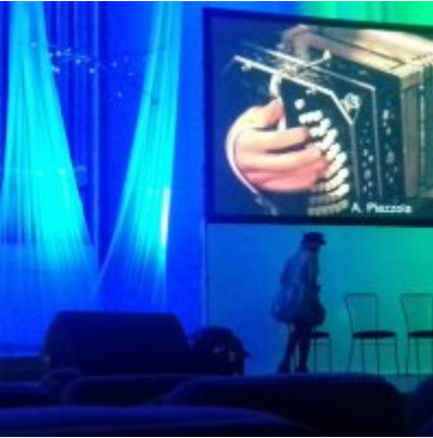
WIZYTA W FILHARMONII