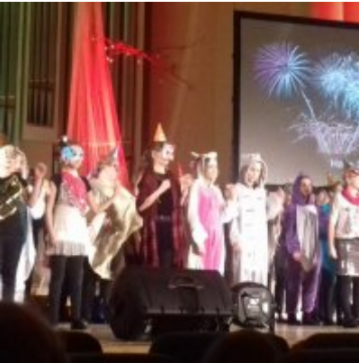
WIZYTA W FILHARMONII