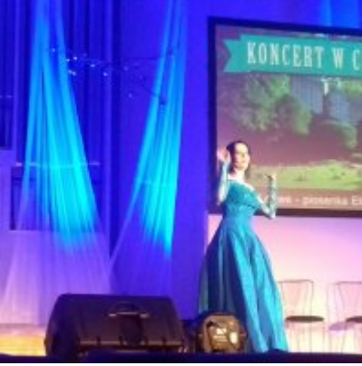
WIZYTA W FILHARMONII