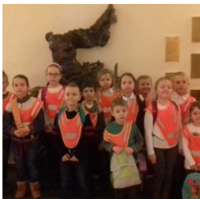
WIZYTA W FILHARMONII