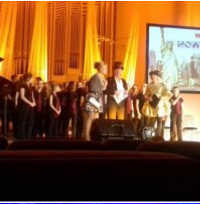
WIZYTA W FILHARMONII