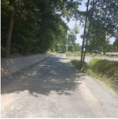
Modernizacja drogi wewnętrznej (do pól) nr 98 w Zatorze na odcinku 435 m.