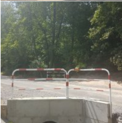
Modernizacja drogi wewnętrznej (do pól) nr 98 w Zatorze na odcinku 435 m.