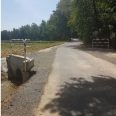
Modernizacja drogi wewnętrznej (do pól) nr 98 w Zatorze na odcinku 435 m.