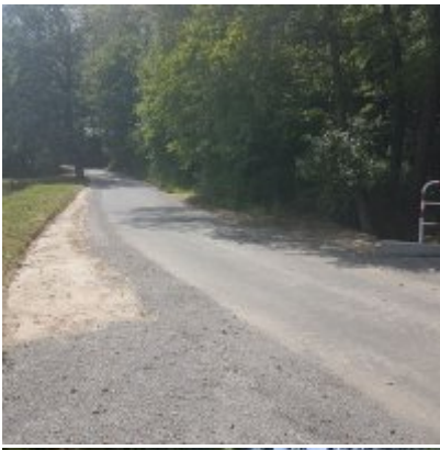
Modernizacja drogi wewnętrznej (do pól) nr 98 w Zatorze na odcinku 435 m.