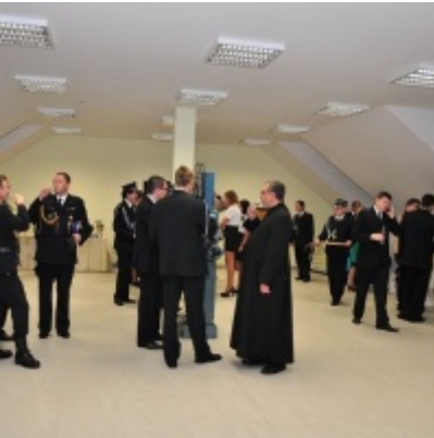
Modernizacja OSP w Zatorze