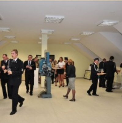
Modernizacja OSP w Zatorze