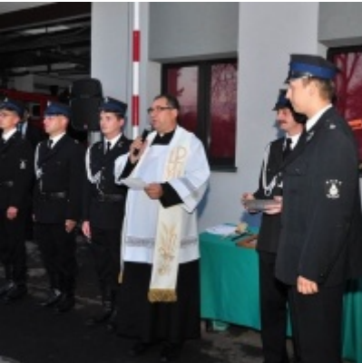
Modernizacja OSP w Zatorze