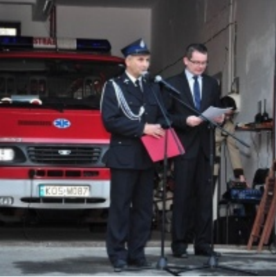
Modernizacja OSP w Zatorze