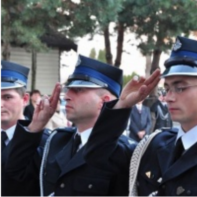
Modernizacja OSP w Zatorze