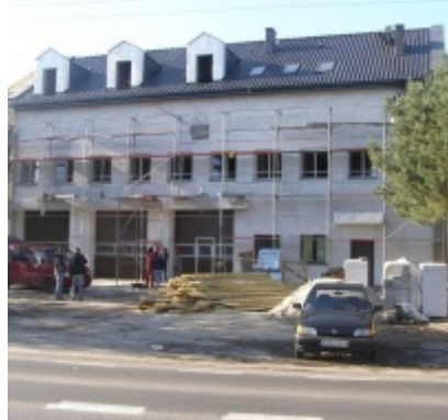
Modernizacja OSP w Zatorze