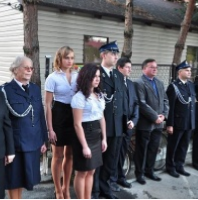
Modernizacja OSP w Zatorze