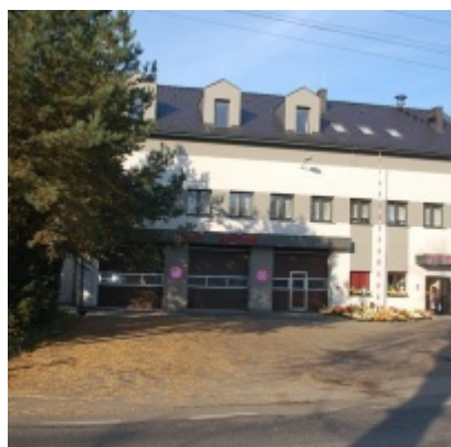
Modernizacja OSP w Zatorze