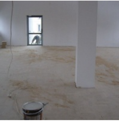
Modernizacja OSP w Zatorze