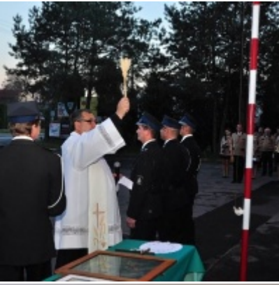
Modernizacja OSP w Zatorze