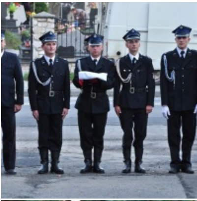
Modernizacja OSP w Zatorze