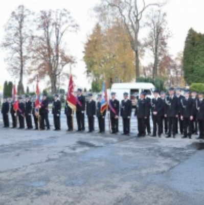
Modernizacja OSP w Zatorze