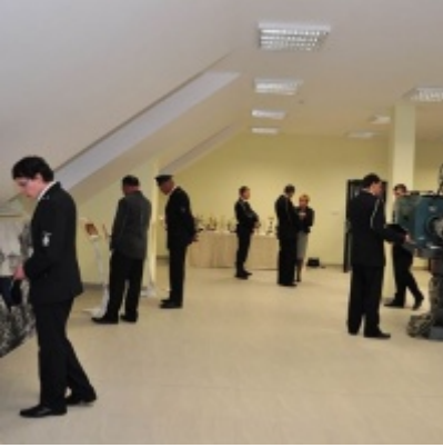
Modernizacja OSP w Zatorze