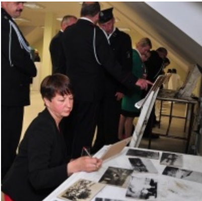
Modernizacja OSP w Zatorze