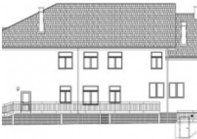
Modernizacja Domów Ludowych w Rudzach