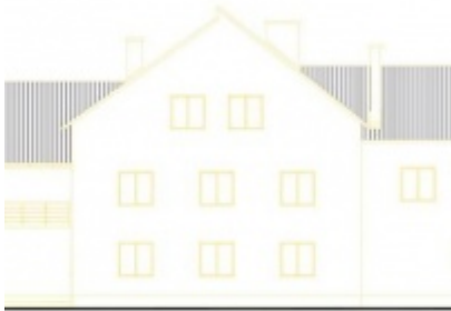
Modernizacja Domów Ludowych w Palczowicach