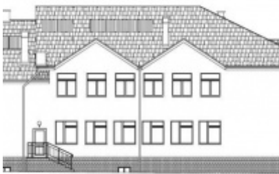
Modernizacja Domów Ludowych w Rudzach