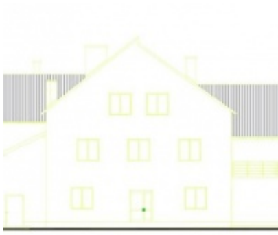
Modernizacja Domów Ludowych w Palczowicach