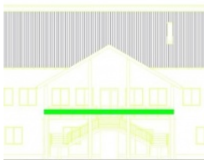
Modernizacja Domów Ludowych w Palczowicach