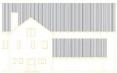
Modernizacja Domów Ludowych w Palczowicach