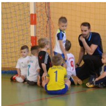
Mikołajkowy Turniej Piłki Nożnej Skrzatów , Żaków i Orlików