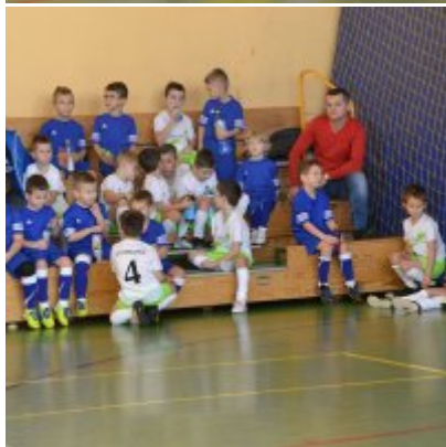
Mikołajkowy Turniej Piłki Nożnej Skrzatów , Żaków i Orlików