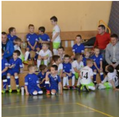
Mikołajkowy Turniej Piłki Nożnej Skrzatów , Żaków i Orlików