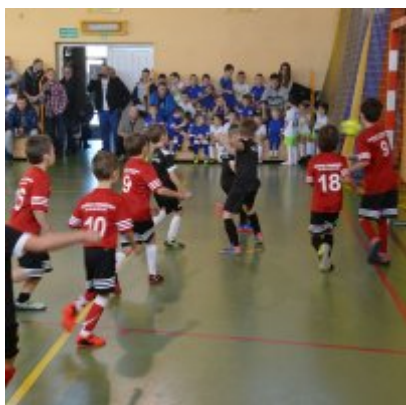
Mikołajkowy Turniej Piłki Nożnej Skrzatów , Żaków i Orlików