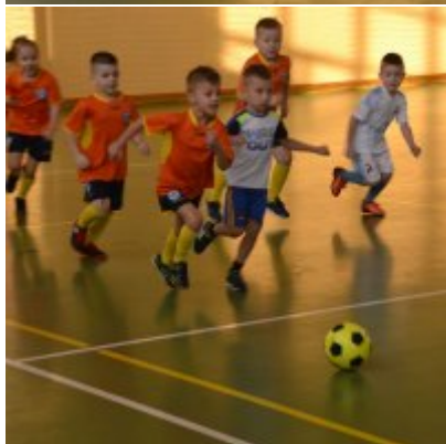
Mikołajkowy Turniej Piłki Nożnej Skrzatów , Żaków i Orlików