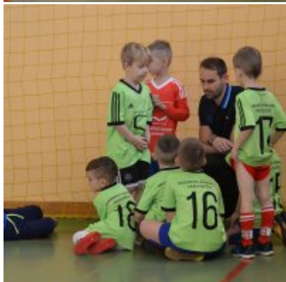
Mikołajkowy Turniej Piłki Nożnej Skrzatów , Żaków i Orlików