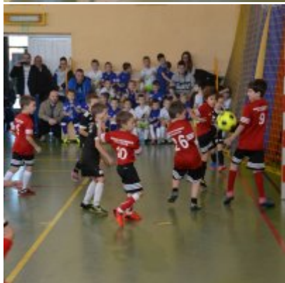
Mikołajkowy Turniej Piłki Nożnej Skrzatów , Żaków i Orlików