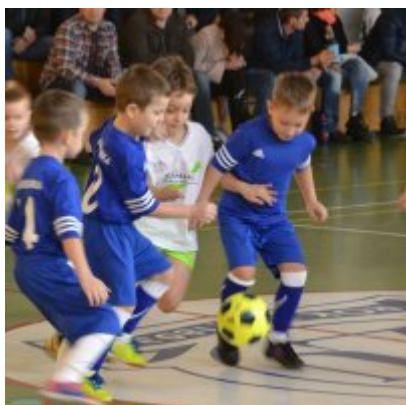
Mikołajkowy Turniej Piłki Nożnej Skrzatów , Żaków i Orlików