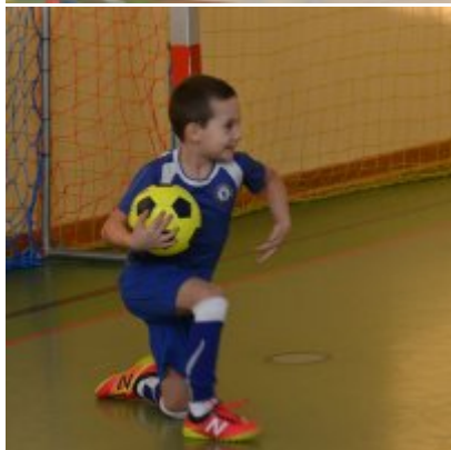
Mikołajkowy Turniej Piłki Nożnej Skrzatów , Żaków i Orlików