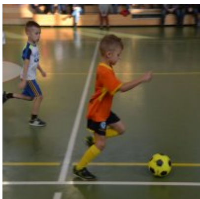
Mikołajkowy Turniej Piłki Nożnej Skrzatów , Żaków i Orlików