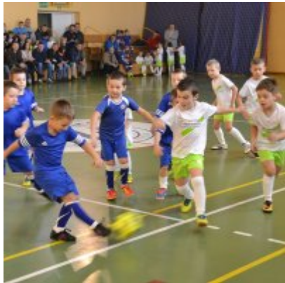
Mikołajkowy Turniej Piłki Nożnej Skrzatów , Żaków i Orlików