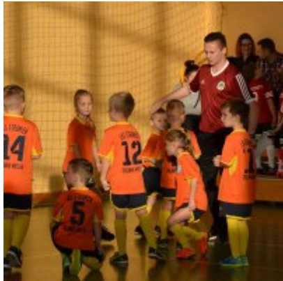
Mikołajkowy Turniej Piłki Nożnej Skrzatów , Żaków i Orlików