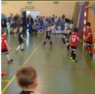
Mikołajkowy Turniej Piłki Nożnej Skrzatów , Żaków i Orlików