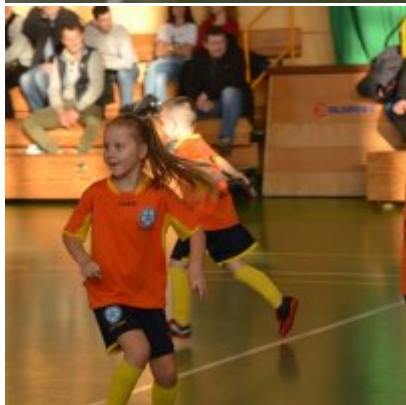
Mikołajkowy Turniej Piłki Nożnej Skrzatów , Żaków i Orlików