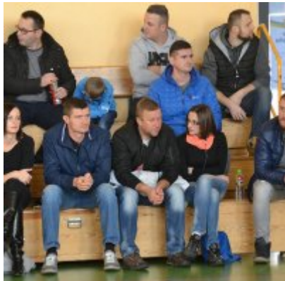
Mikołajkowy Turniej Piłki Nożnej Skrzatów , Żaków i Orlików