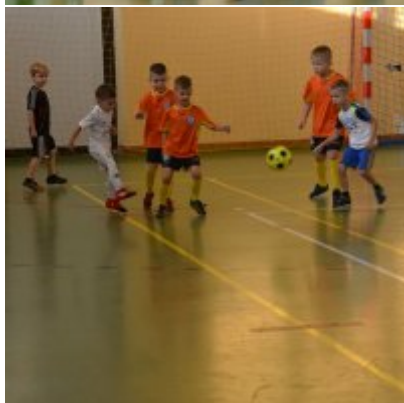
Mikołajkowy Turniej Piłki Nożnej Skrzatów , Żaków i Orlików