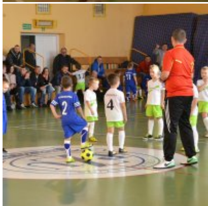
Mikołajkowy Turniej Piłki Nożnej Skrzatów , Żaków i Orlików