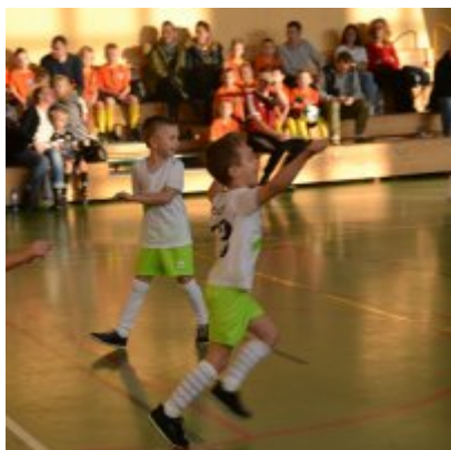
Mikołajkowy Turniej Piłki Nożnej Skrzatów , Żaków i Orlików