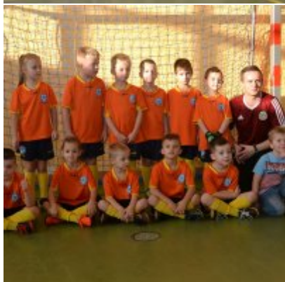
Mikołajkowy Turniej Piłki Nożnej Skrzatów , Żaków i Orlików