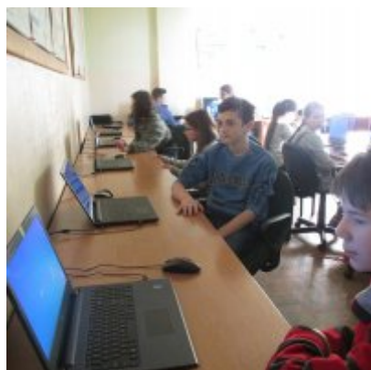
MAKS MATEMATYCZNY W ZATORSKIEJ PODSTWÓWCE I GIMNAZJUM