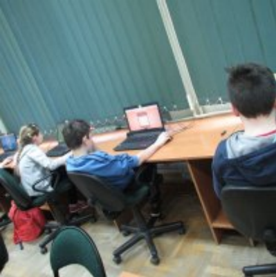
MAKS MATEMATYCZNY W ZATORSKIEJ PODSTWÓWCE I GIMNAZJUM