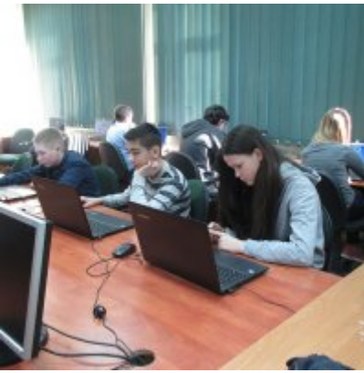
MAKS MATEMATYCZNY W ZATORSKIEJ PODSTWÓWCE I GIMNAZJUM