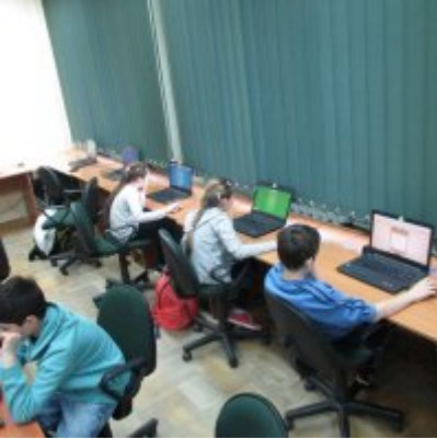
MAKS MATEMATYCZNY W ZATORSKIEJ PODSTWÓWCE I GIMNAZJUM