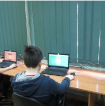
MAKS MATEMATYCZNY W ZATORSKIEJ PODSTWÓWCE I GIMNAZJUM