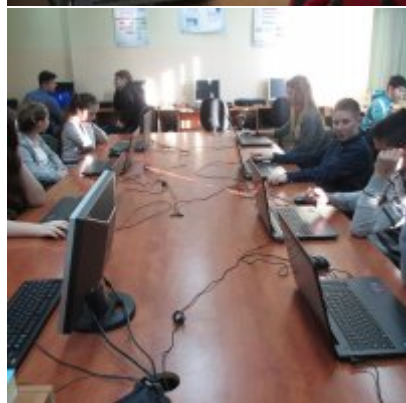
MAKS MATEMATYCZNY W ZATORSKIEJ PODSTWÓWCE I GIMNAZJUM