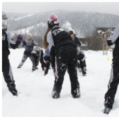
Lekkoatletyka „Pod Giewontem”