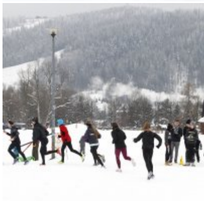
Lekkoatletyka „Pod Giewontem”