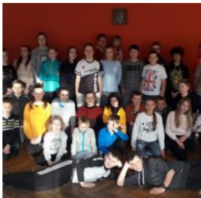
Lekkoatletyka „Pod Giewontem”