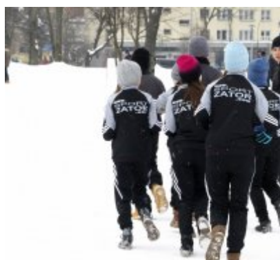
Lekkoatletyka „Pod Giewontem”