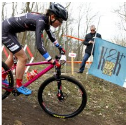
Kolejny pracowity weekend SOKOŁA Zator