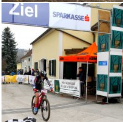
Kolejny pracowity weekend SOKOŁA Zator