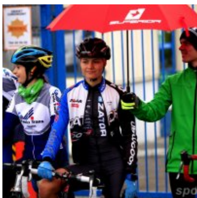
Kolarze zainaugurowali sezon przełajowy.