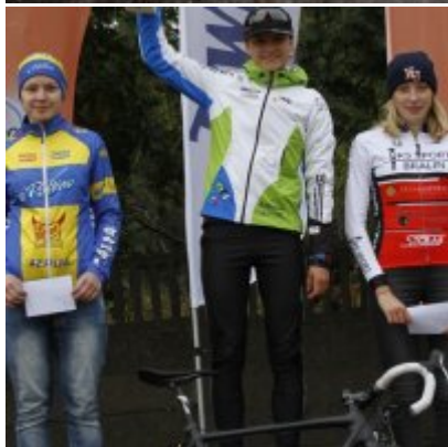
Kolarze zainaugurowali sezon przełajowy.