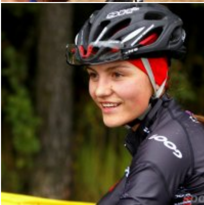
Kolarze zainaugurowali sezon przetajowy.