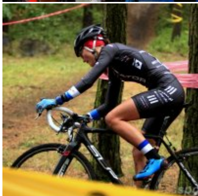
Kolarze zainaugurowali sezon przełajowy.