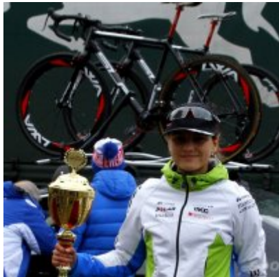
Kolarze zainaugurowali sezon przełajowy.