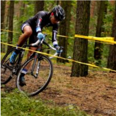
Kolarze zainaugurowali sezon przetajowy.