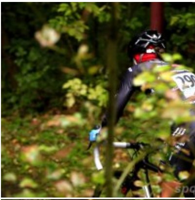
Kolarze zainaugurowali sezon przetajowy.