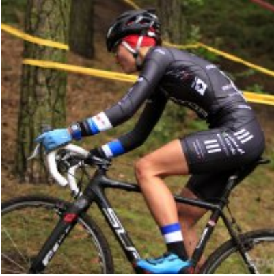
Kolarze zainaugurowali sezon przetajowy.