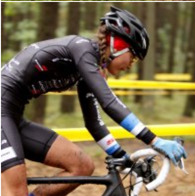
Kolarze zainaugurowali sezon przetajowy.