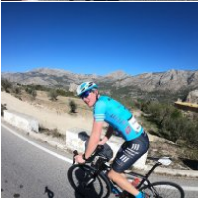
Kadrowicze kończą zgrupowanie w Hiszpanii...