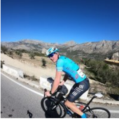
Kadrowicze kończą zgrupowanie w Hiszpanii...