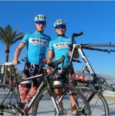
Kadrowicze kończą zgrupowanie w Hiszpanii.