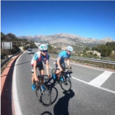
Kadrowicze kończą zgrupowanie w Hiszpanii...