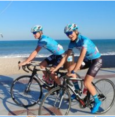
Kadrowicze kończą zgrupowanie w Hiszpanii.