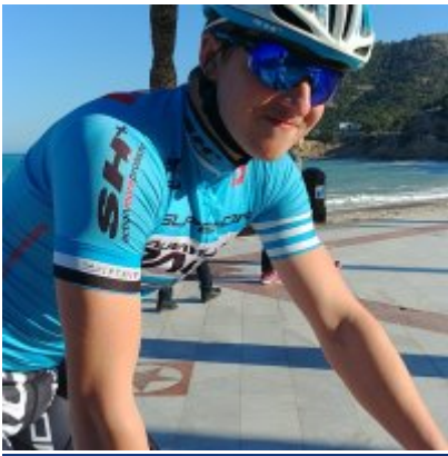
Kadrowicze kończą zgrupowanie w Hiszpanii...