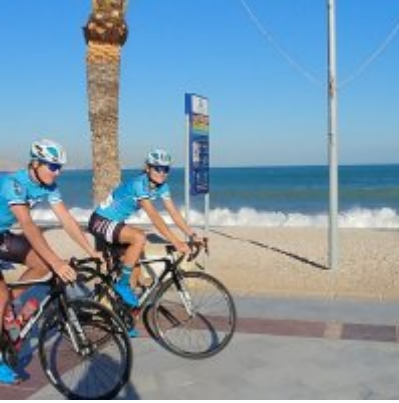
Kadrowicze kończą zgrupowanie w Hiszpanii.