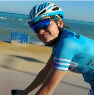
Kadrowicze kończą zgrupowanie w Hiszpanii.