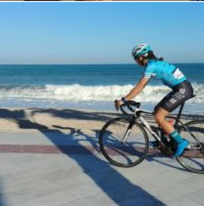
Kadrowicze kończą zgrupowanie w Hiszpanii.