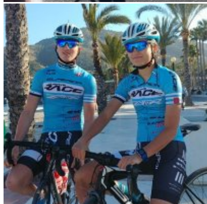
Kadrowicze kończą zgrupowanie w Hiszpanii.