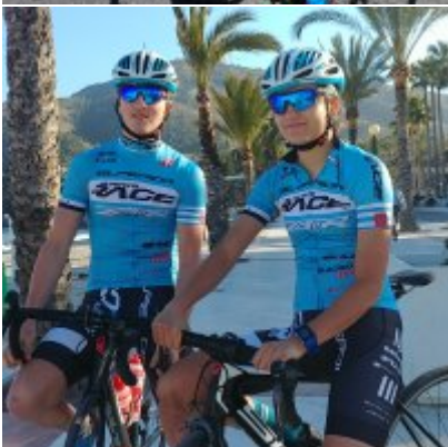
Kadrowicze kończą zgrupowanie w Hiszpanii...