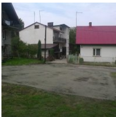
II etap modernizacji ul. Młyńskiej w Zatorze

Koszt robót zasadniczych – 8 000,00 zł brutto