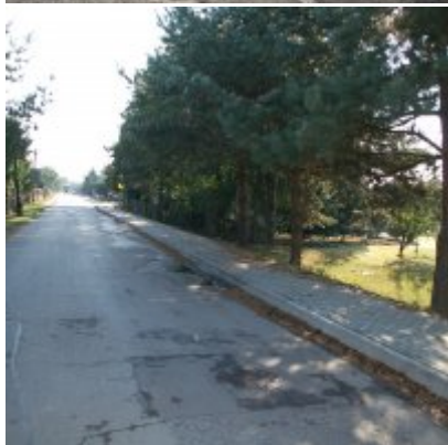
Budowa prawostronnego chodnika wzdłuż drogi gminnej – ul. E. Orzeszkowej