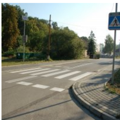
Budowa i przebudowa fragmentów lewostronnego i prawostronnego chodnika wzdłuż ul. Piastowskiej w Zatorze

Koszt robót zasadniczych – 3 800,00 zł brutto