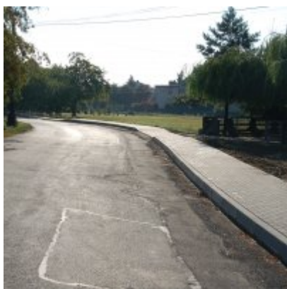
Budowa prawostronnego chodnika wzdłuż drogi gminnej – ul. E. Orzeszkowej

Koszt robót zasadniczych – 40 700,00 zł brutto