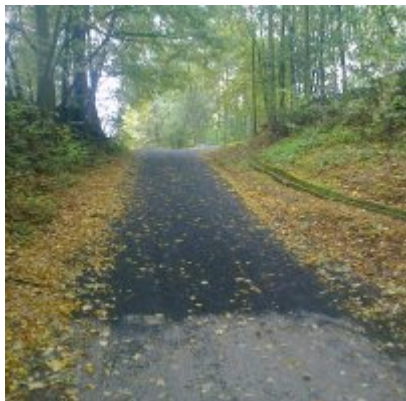
Przebudowa drogi wewnętrznej w Laskowej o długości ok. 35 mb

Koszt robót zasadniczych – 5 000,00 zł brutto