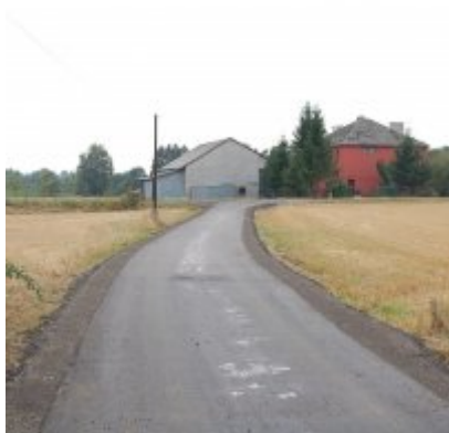
Modernizacja odcinka ul. Kwiatowej w Zatorze o długości ok. 90 mb

Koszt robót zasadniczych – 25 000,00 zł brutto