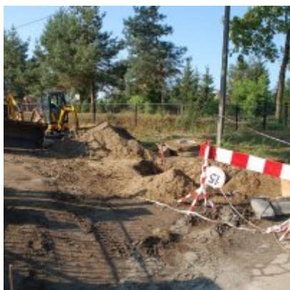
Budowa odwodnienia ul. Gimnazjalnej w Podolszu

Koszt robót zasadniczych – 30 000,00 zł brutto