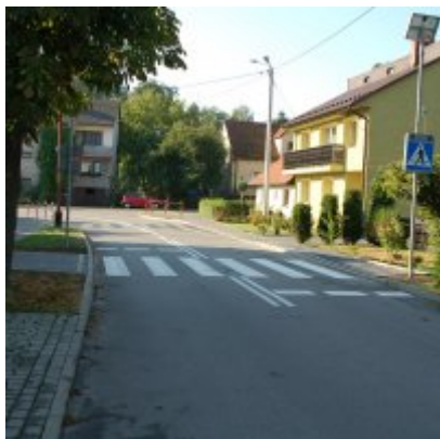
Budowa i przebudowa fragmentów lewostronnego i prawostronnego chodnika wzdłuż ul. Piastowskiej w Zatorze.