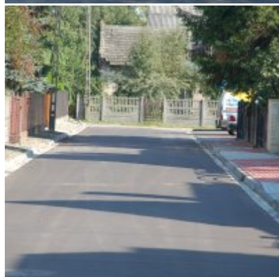
os. Królewiec w Zatorze