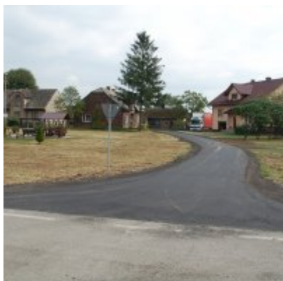
Modernizacja drogi w Smolicach (Lipowej) o długości ok. 60 mb.

Koszt robót zasadniczych – 15 000,00 zł brutto