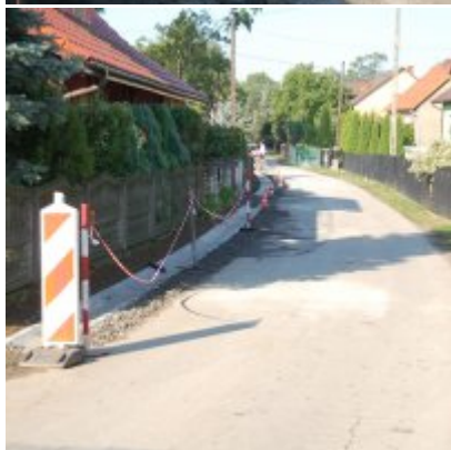
Budowa odwodnienia ul. Gimnazjalnej w Podolszu