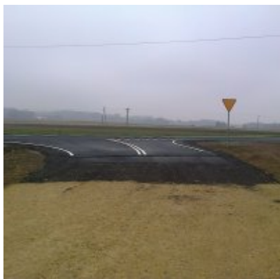
Budowa włączenia drogi gminnej nr 510423K do drogi krajowej nr 28 w Graboszycach

Koszt robót zasadniczych – 20 000,00 zł brutto