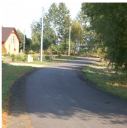
2. Przebudowa ul. Jagodowej w Podolszu