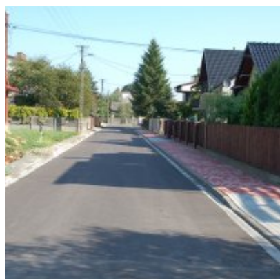
os. Królewiec w Zatorze

Koszt robót zasadniczych – 97 786,86 zł brutto