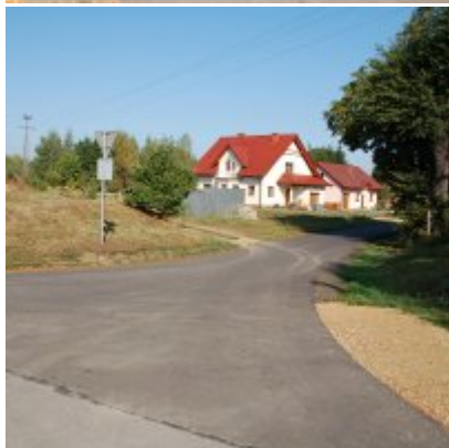
2. Przebudowa ul. Jagodowej w Podolszu