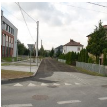
Remont odcinka ul. Leszka Palimąki w Zatorze o długości ok. 80 mb.

Koszt robót zasadniczych – 13 000,00 zł brutto