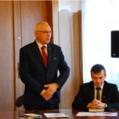
I sesja VIII kadencji Rady Miejskiej w Zatorze