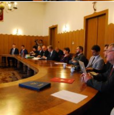
I sesja VIII kadencji Rady Miejskiej w Zatorze