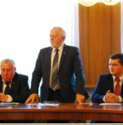
I sesja VIII kadencji Rady Miejskiej w Zatorze