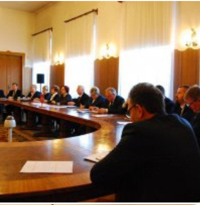
I sesja VIII kadencji Rady Miejskiej w Zatorze