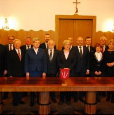
I sesja VIII kadencji Rady Miejskiej w Zatorze