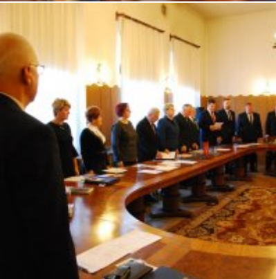
I sesja VIII kadencji Rady Miejskiej w Zatorze