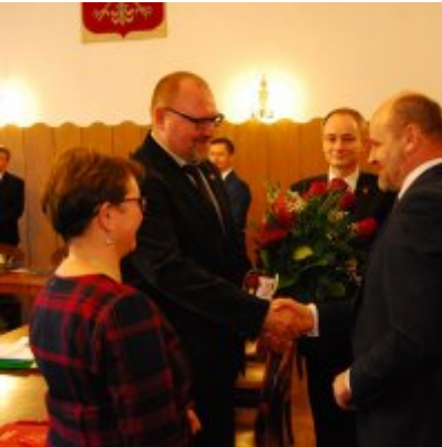
I sesja VIII kadencji Rady Miejskiej w Zatorze