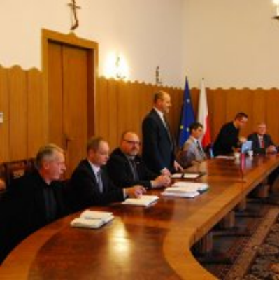
I sesja VIII kadencji Rady Miejskiej w Zatorze