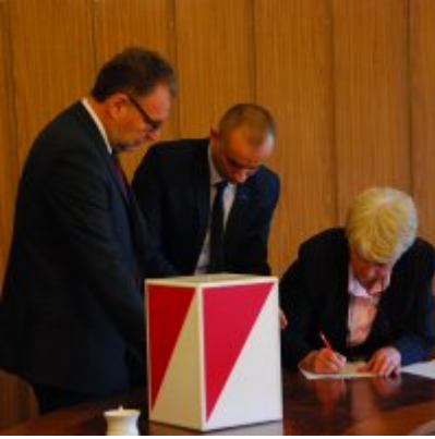
I sesja VIII kadencji Rady Miejskiej w Zatorze