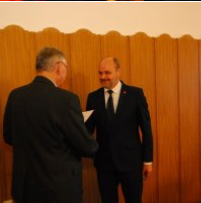
I sesja VIII kadencji Rady Miejskiej w Zatorze