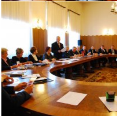
I sesja VIII kadencji Rady Miejskiej w Zatorze