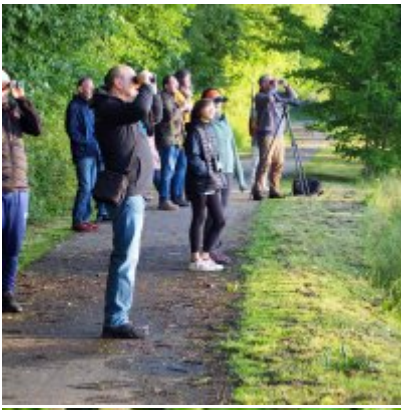
I Spacer po Zatorskim Parku z Burmistrzem Zatora