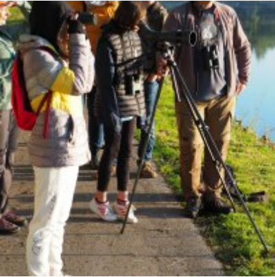
I Spacer po Zatorskim Parku z Burmistrzem Zatora