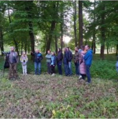
I Spacer po Zatorskim Parku z Burmistrzem Zatora