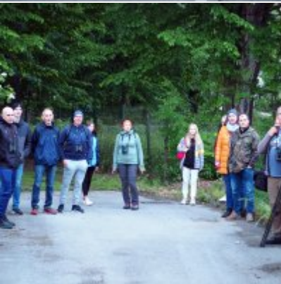
I Spacer po Zatorskim Parku z Burmistrzem Zatora