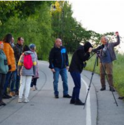
I Spacer po Zatorskim Parku z Burmistrzem Zatora