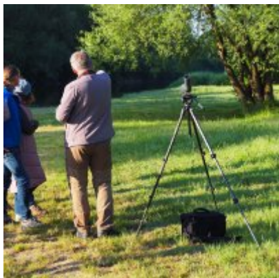
I Spacer po Zatorskim Parku z Burmistrzem Zatora