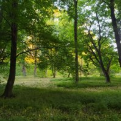
I Spacer po Zatorskim Parku z Burmistrzem Zatora