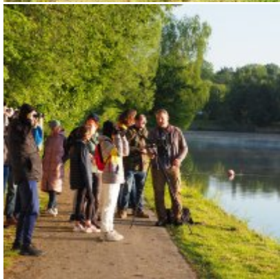
I Spacer po Zatorskim Parku z Burmistrzem Zatora