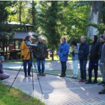
I Spacer po Zatorskim Parku z Burmistrzem Zatora