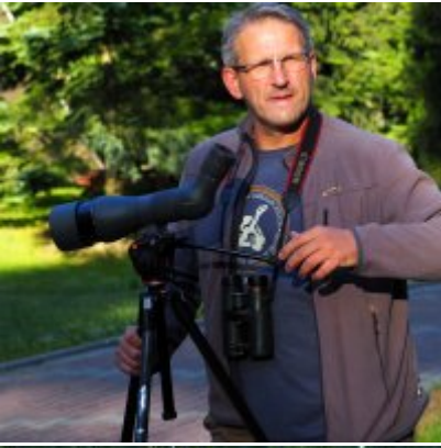
I Spacer po Zatorskim Parku z Burmistrzem Zatora