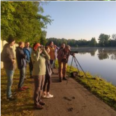
I Spacer po Zatorskim Parku z Burmistrzem Zatora