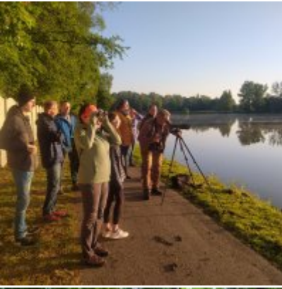
I Spacer po Zatorskim Parku z Burmistrzem Zatora