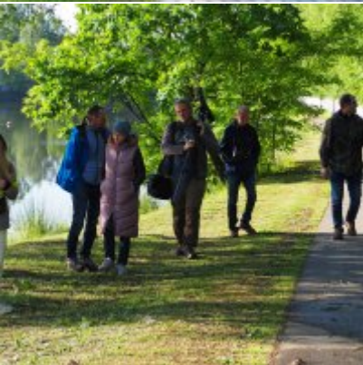
I Spacer po Zatorskim Parku z Burmistrzem Zatora