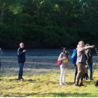
I Spacer po Zatorskim Parku z Burmistrzem Zatora