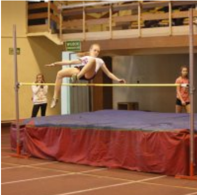
Halowy Miting lekkoatletyczny