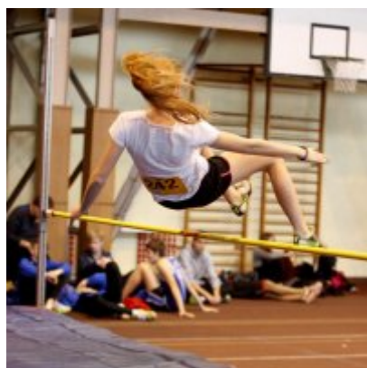
Halowy Miting lekkoatletyczny