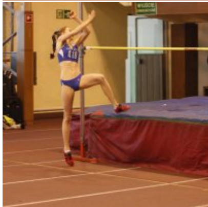
Halowy Miting lekkoatletyczny