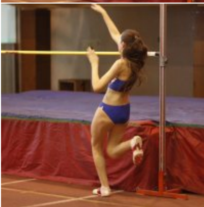
Halowy Miting lekkoatletyczny