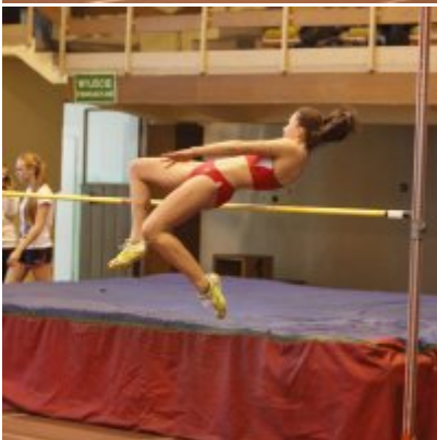
Halowy Miting lekkoatletyczny