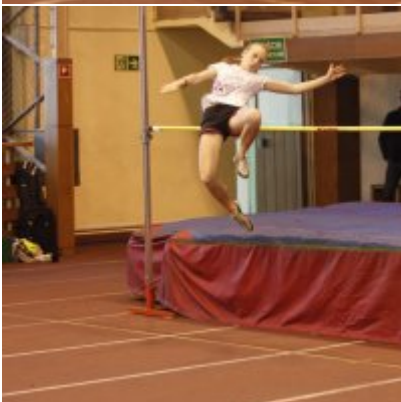
Halowy Miting lekkoatletyczny