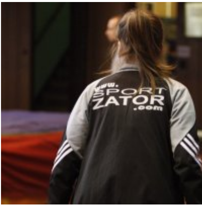
Halowy Miting lekkoatletyczny