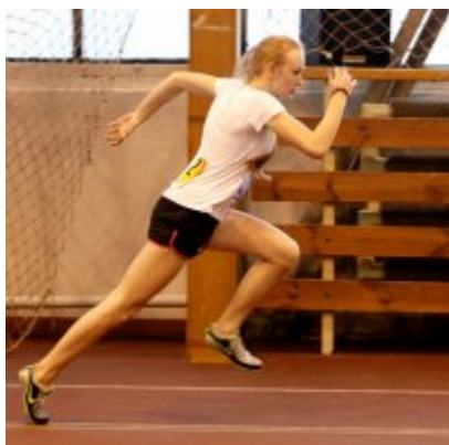
Halowy Miting lekkoatletyczny