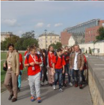
Goście ze słowackich Bojnic w Podolszu