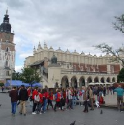
Goście ze słowackich Bojnic w Podolszu