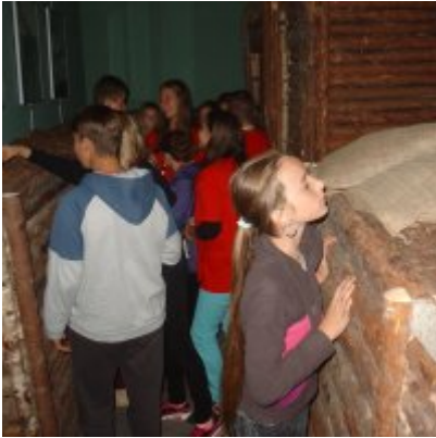
Goście ze słowackich Bojnic w Podolszu