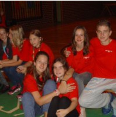
Goście ze słowackich Bojnic w Podolszu