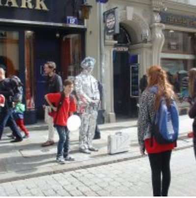
Goście ze słowackich Bojnic w Podolszu