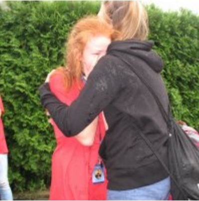
Goście ze słowackich Bojnic w Podolszu