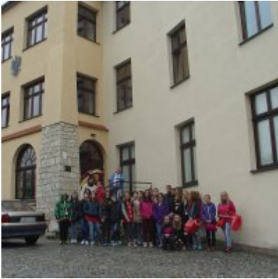
Goście ze słowackich Bojnic w Podolszu