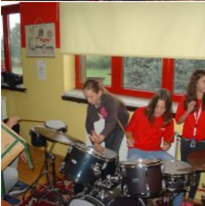
Goście ze słowackich Bojnic w Podolszu