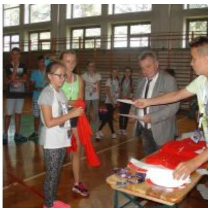
Goście ze słowackich Bojnic w Podolszu.