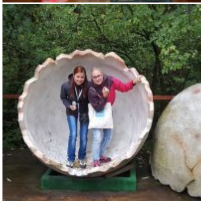
Goście ze słowackich Bojnic w Podolszu.