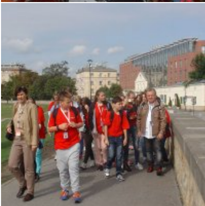
Goście ze słowackich Bojnic w Podolszu