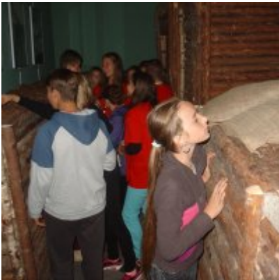
Goście ze słowackich Bojnic w Podolszu