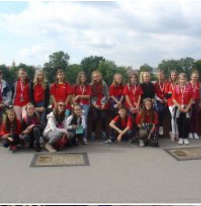
Goście ze słowackich Bojnic w Podolszu