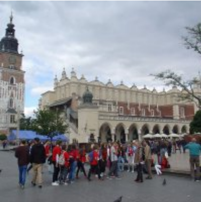
Goście ze słowackich Bojnic w Podolszu