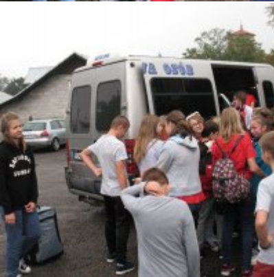
Goście ze słowackich Bojnic w Podolszu