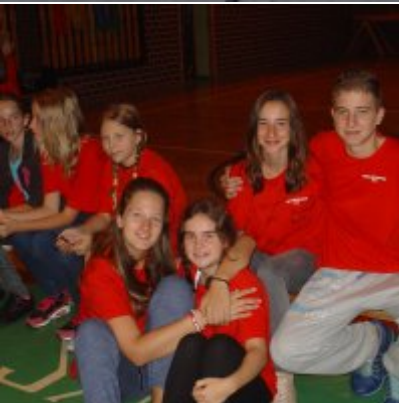
Goście ze słowackich Bojnic w Podolszu