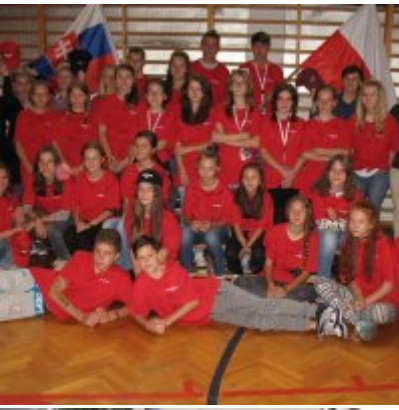
Goście ze słowackich Bojnic w Podolszu