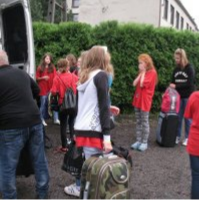
Goście ze słowackich Bojnic w Podolszu