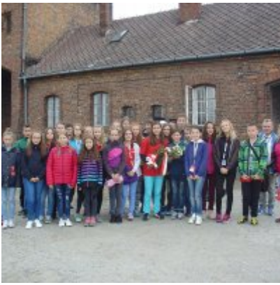
Goście ze słowackich Bojnic w Podolszu