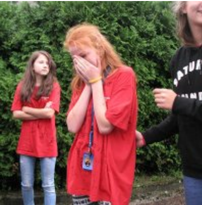
Goście ze słowackich Bojnic w Podolszu