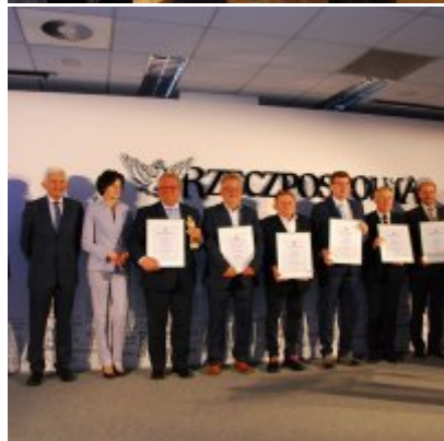
Gmina Zator na II miejscu w kraju.