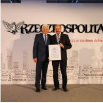
Gmina Zator na II miejscu w kraju.