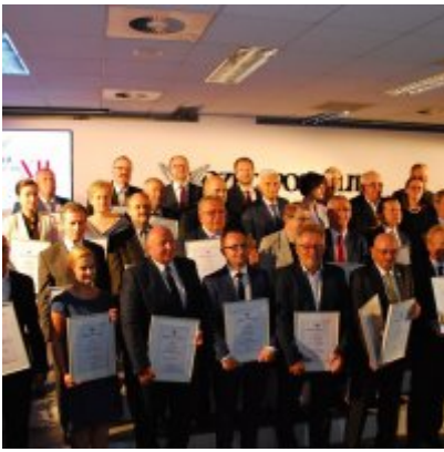
Gmina Zator na II miejscu w kraju.