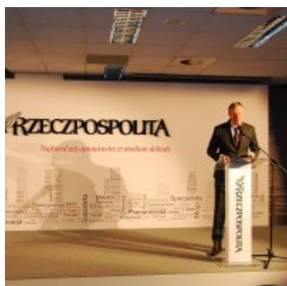
Gmina Zator na II miejscu w kraju.

Działania oraz praca zatorskiego samorządu na rzecz swoich mieszkańców zostały docenione i nagrodzone.