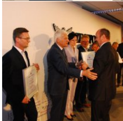
Gmina Zator na II miejscu w kraju.