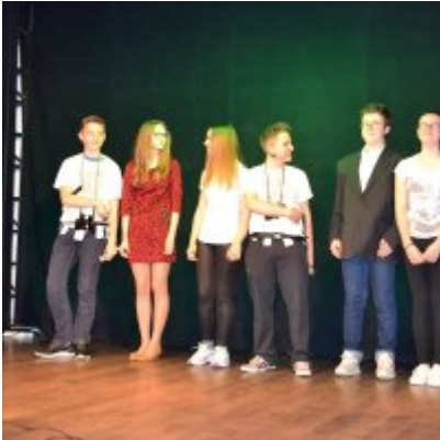
GALA KONKURSU DRABBLE