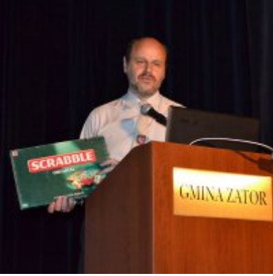
GALA KONKURSU DRABBLE