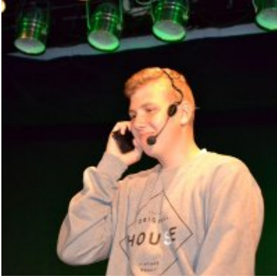
GALA KONKURSU DRABBLE