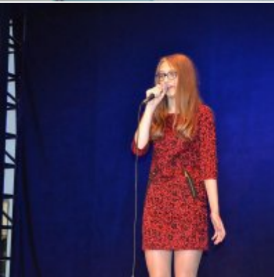
GALA KONKURSU DRABBLE