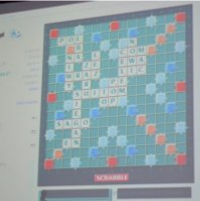
GALA KONKURSU DRABBLE