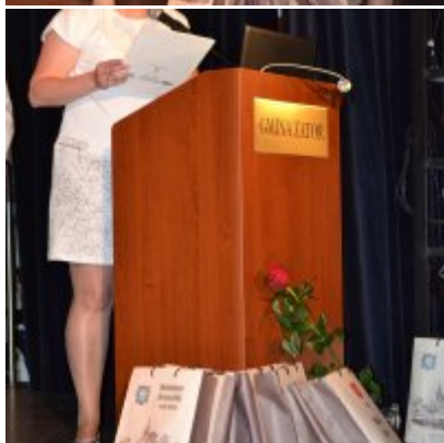
GALA KONKURSU DRABBLE