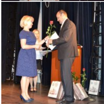
GALA KONKURSU DRABBLE