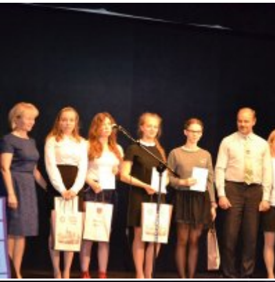
GALA KONKURSU DRABBLE