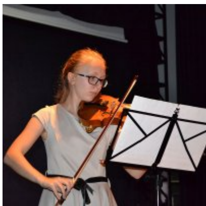
GALA KONKURSU DRABBLE