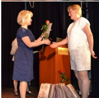
GALA KONKURSU DRABBLE