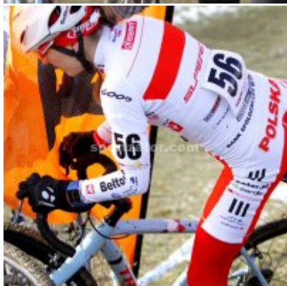
Finał Puchar Polski w Tarnowie i świetny występ Gabrieli Wojtyły