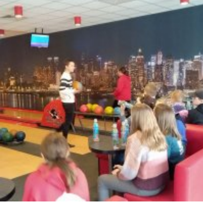
Ferie w Podolszu