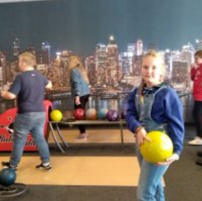
Ferie w Podolszu