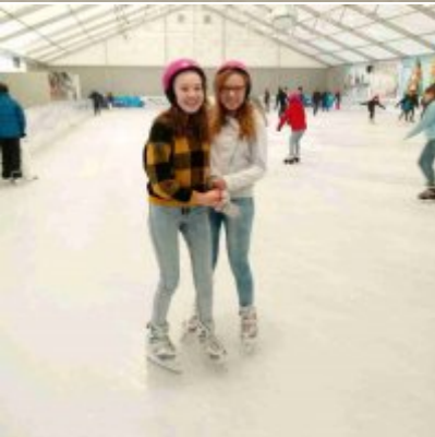
Ferie w Podolszu