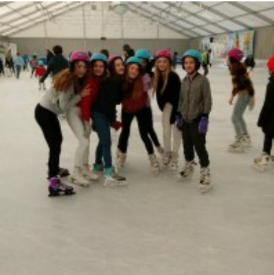
Ferie w Podolszu