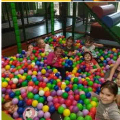
Ferie w Podolszu