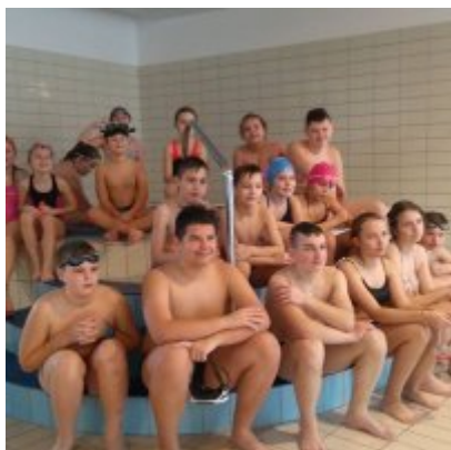
Ferie w Podolszu