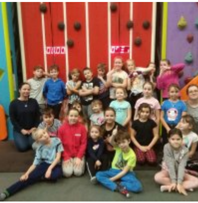
Ferie w Podolszu