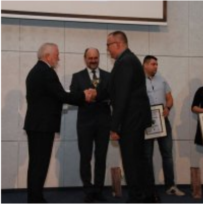
FOTOGALERIA Zatorska Gala Przedsiębiorczości 2018