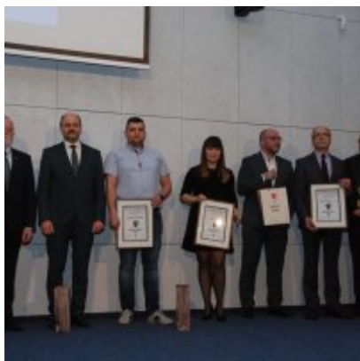
FOTOGALERIA Zatorska Gala Przedsiębiorczości 2018