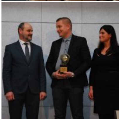
FOTOGALERIA Zatorska Gala Przedsiębiorczości 2018