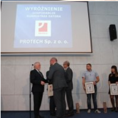
FOTOGALERIA Zatorska Gala Przedsiębiorczości 2018