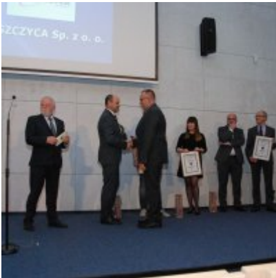
FOTOGALERIA Zatorska Gala Przedsiębiorczości 2018