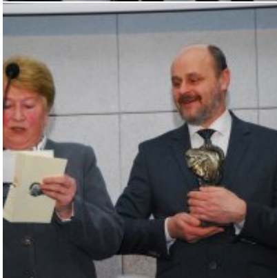
FOTOGALERIA Zatorska Gala Przedsiębiorczości 2018