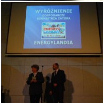
FOTOGALERIA Zatorska Gala Przedsiębiorczości 2018