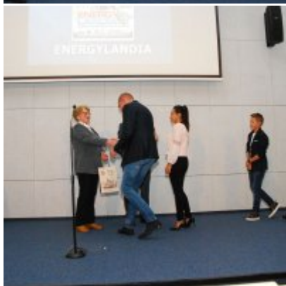
FOTOGALERIA Zatorska Gala Przedsiębiorczości 2018