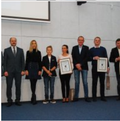
FOTOGALERIA Zatorska Gala Przedsiębiorczości 2018