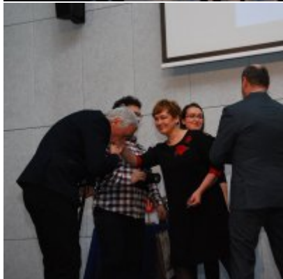
FOTOGALERIA Zatorska Gala Przedsiębiorczości 2018