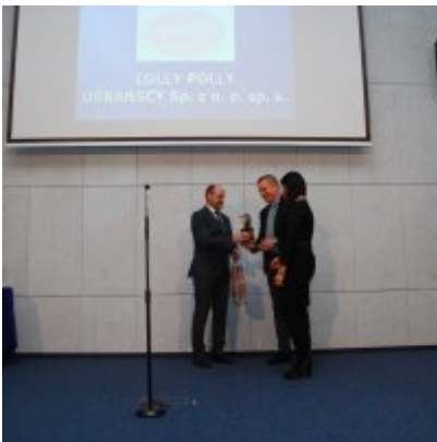
FOTOGALERIA Zatorska Gala Przedsiębiorczości 2018