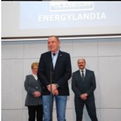
FOTOGALERIA Zatorska Gala Przedsiębiorczości 2018