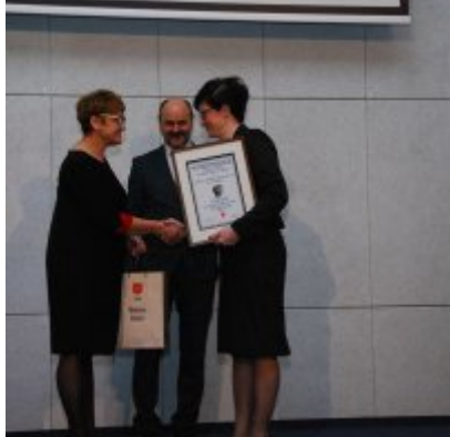
FOTOGALERIA Zatorska Gala Przedsiębiorczości 2018