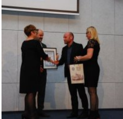
FOTOGALERIA Zatorska Gala Przedsiębiorczości 2018