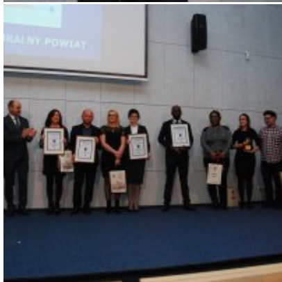
FOTOGALERIA Zatorska Gala Przedsiębiorczości 2018