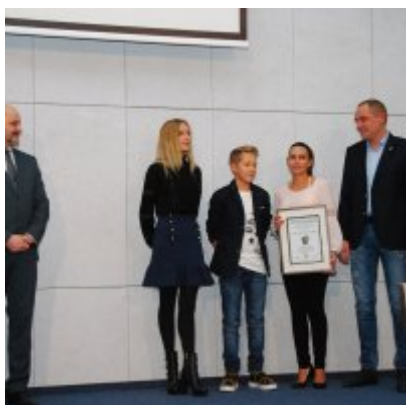
FOTOGALERIA Zatorska Gala Przedsiębiorczości 2018