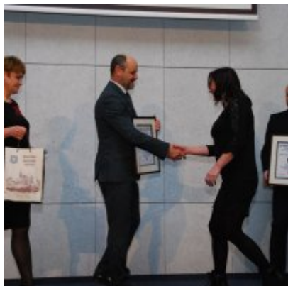
FOTOGALERIA Zatorska Gala Przedsiębiorczości 2018