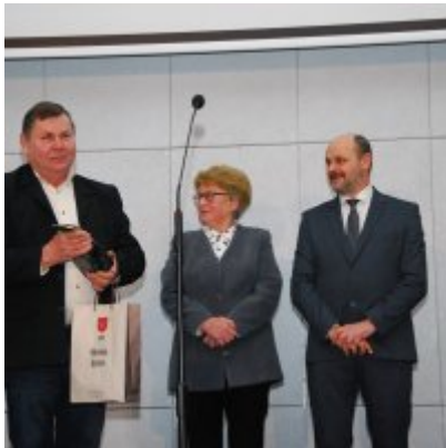
FOTOGALERIA Zatorska Gala Przedsiębiorczości 2018