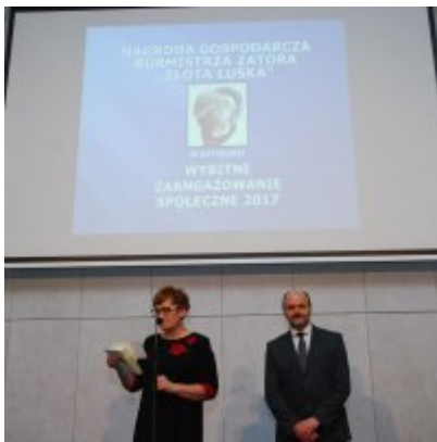
FOTOGALERIA Zatorska Gala Przedsiębiorczości 2018