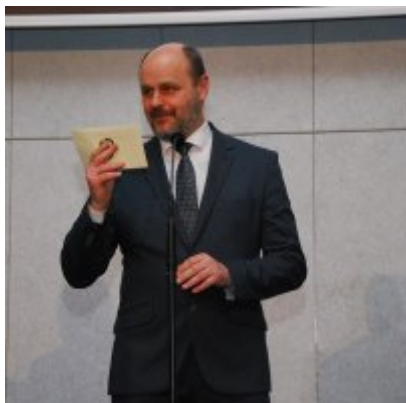
FOTOGALERIA Zatorska Gala Przedsiębiorczości 2018