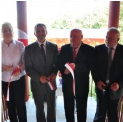
Otwarcie Domu Ludowego w Palczowicach