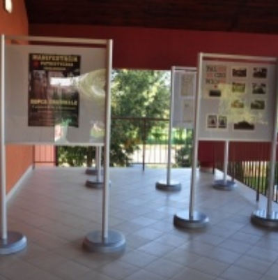
Otwarcie Domu Ludowego w Palczowicach