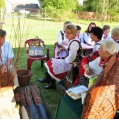
Otwarcie Domu Ludowego w Palczowicach