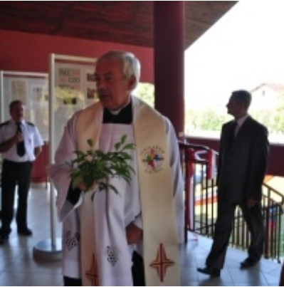
Otwarcie Domu Ludowego w Palczowicach