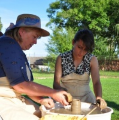
Otwarcie Domu Ludowego w Palczowicach