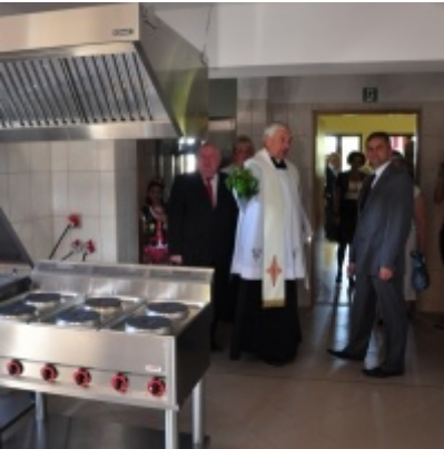
Otwarcie Domu Ludowego w Palczowicach