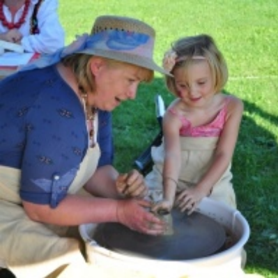
Otwarcie Domu Ludowego w Palczowicach