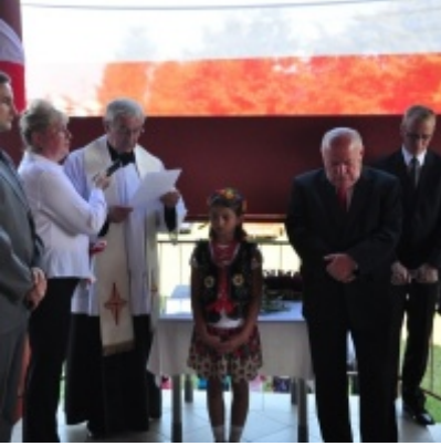
Otwarcie Domu Ludowego w Palczowicach