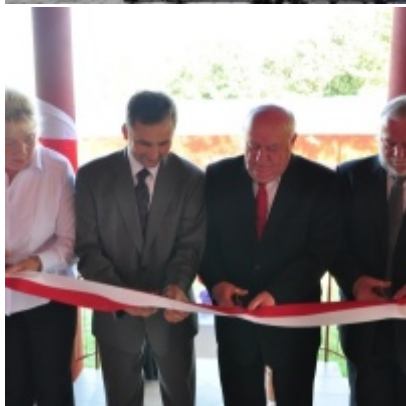
Otwarcie Domu Ludowego w Palczowicach