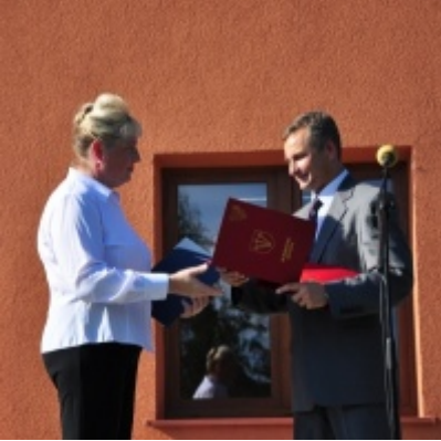
Otwarcie Domu Ludowego w Palczowicach