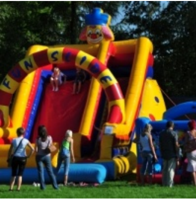
Otwarcie Domu Ludowego w Palczowicach