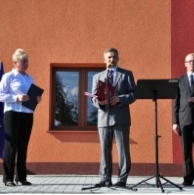
Otwarcie Domu Ludowego w Palczowicach