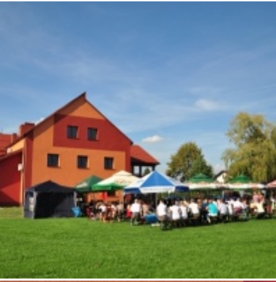
Otwarcie Domu Ludowego w Palczowicach