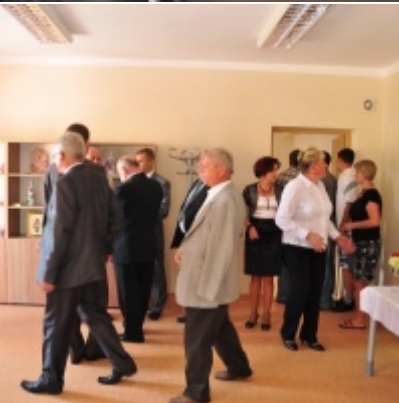
Otwarcie Domu Ludowego w Palczowicach