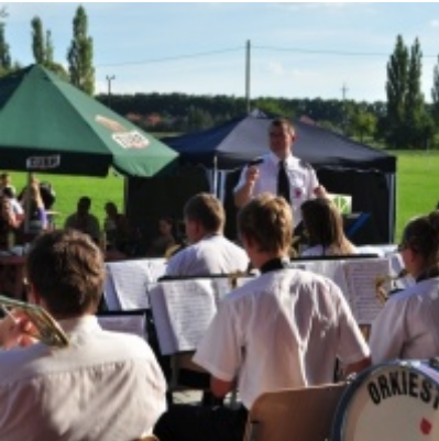
Otwarcie Domu Ludowego w Palczowicach