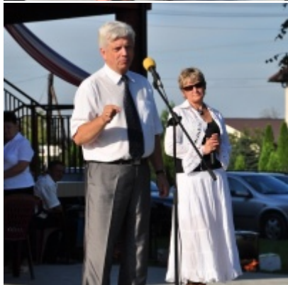
Otwarcie Domu Ludowego w Palczowicach