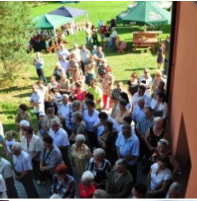
Otwarcie Domu Ludowego w Palczowicach