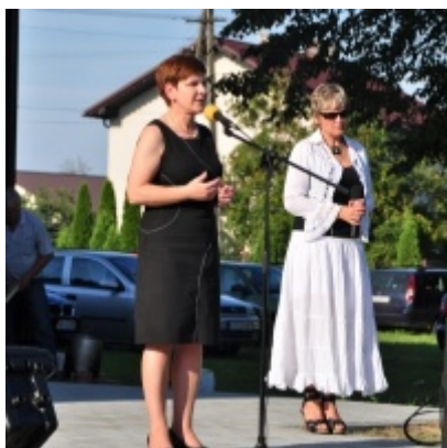
Otwarcie Domu Ludowego w Palczowicach