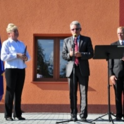
Otwarcie Domu Ludowego w Palczowicach