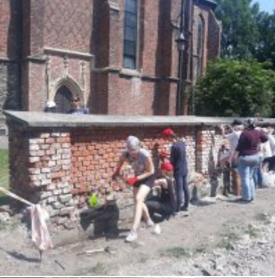
Czerwcowe praktyki studenckie ASP w Zatorze