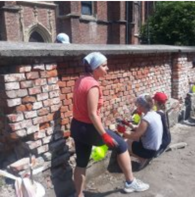
Czerwcowe praktyki studenckie ASP w Zatorze