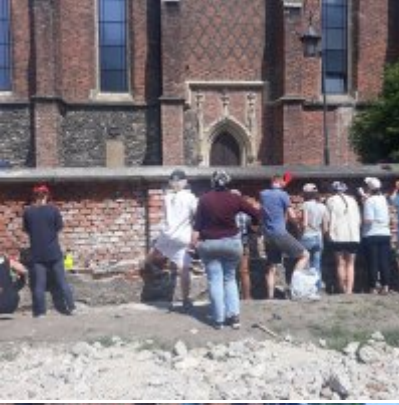
Czerwcowe praktyki studenckie ASP w Zatorze