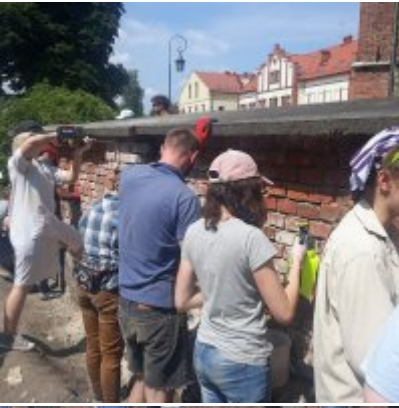
Czerwcowe praktyki studenckie ASP w Zatorze