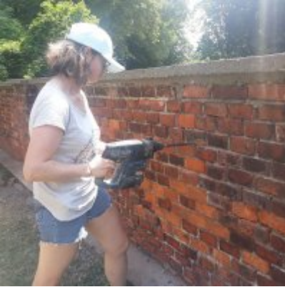
Czerwcowe praktyki studenckie ASP w Zatorze