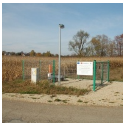
Budowa kolektora i sieci kanalizacyjnej w Graboszycach, Rudzach i Trzebieńczycach