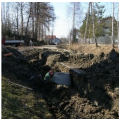
Budowa kolektora i sieci kanalizacyjnej w Graboszycach, Rudzach i Trzebieńczycach