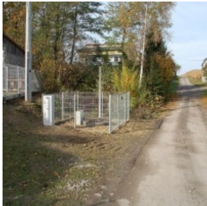
Budowa kolektora i sieci kanalizacyjnej w Graboszycach, Rudzach i Trzebieńczycach