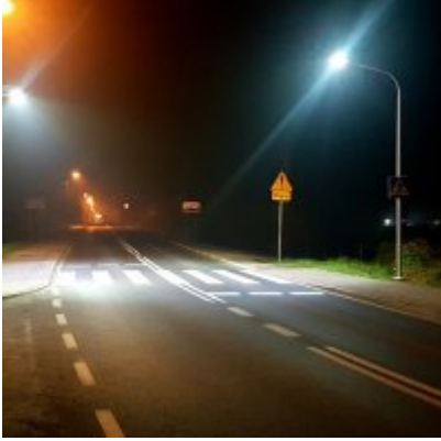
Bezpieczniej na drogach krajowych w Gminie Zator