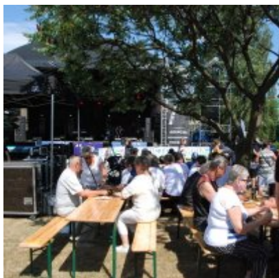
Święto Karpia 2019