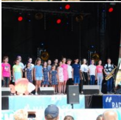
Święto Karpia 2019